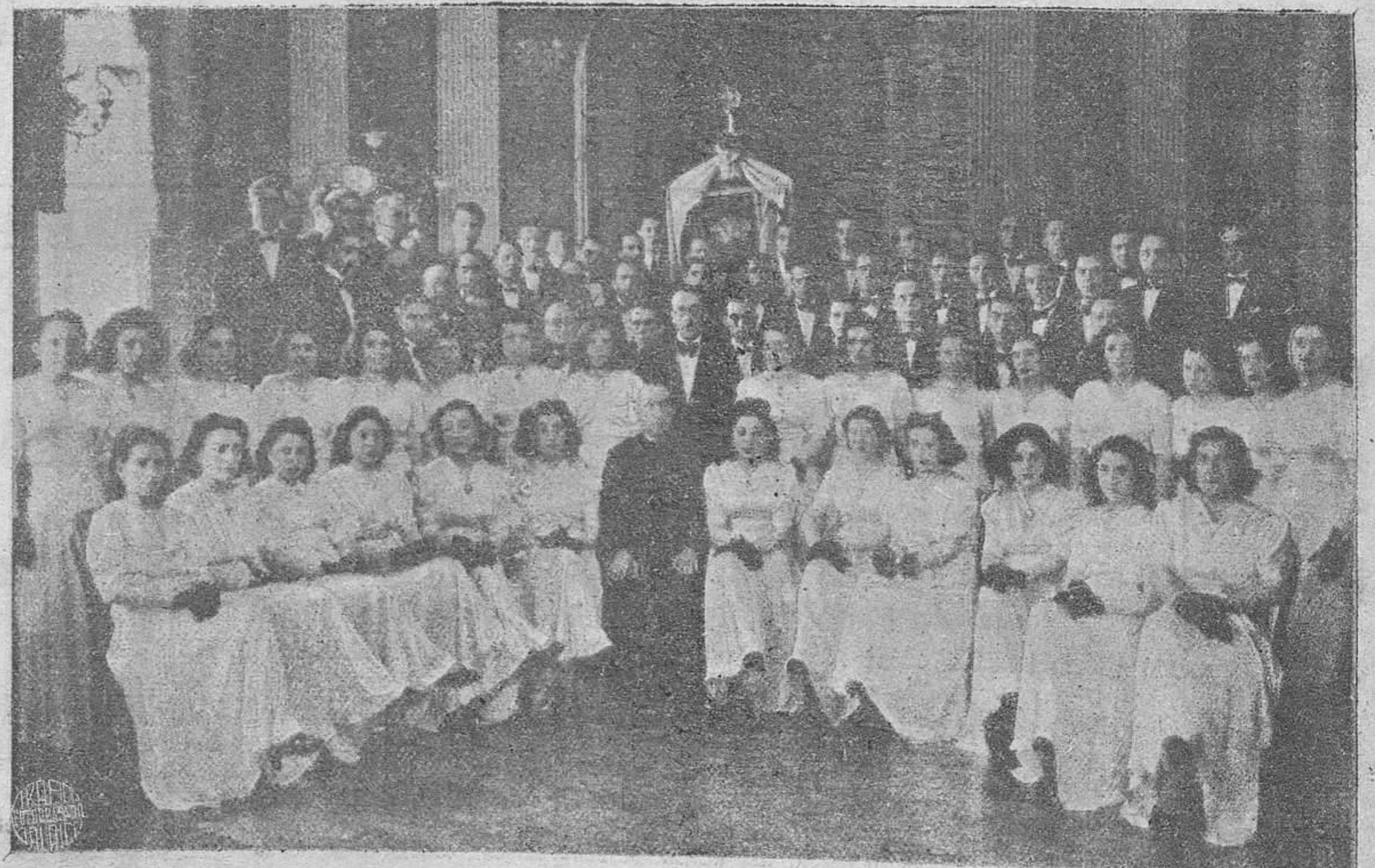
Pletórico de vida, pujante en su vigorosa personalidad artística, el Orfeon Burgales —cincuenta años de existencia al servicio de Burgos y del arte— llega a la cúspide de su gloria, recibiendo del Excmo. Ayuntamiento la Medalla de la Ciudad como premio a su benemérita labor. He aquí a nuestra laureada coral, en el día de hoy, en que cumple el quincuagésimo aniversario de su fundación.