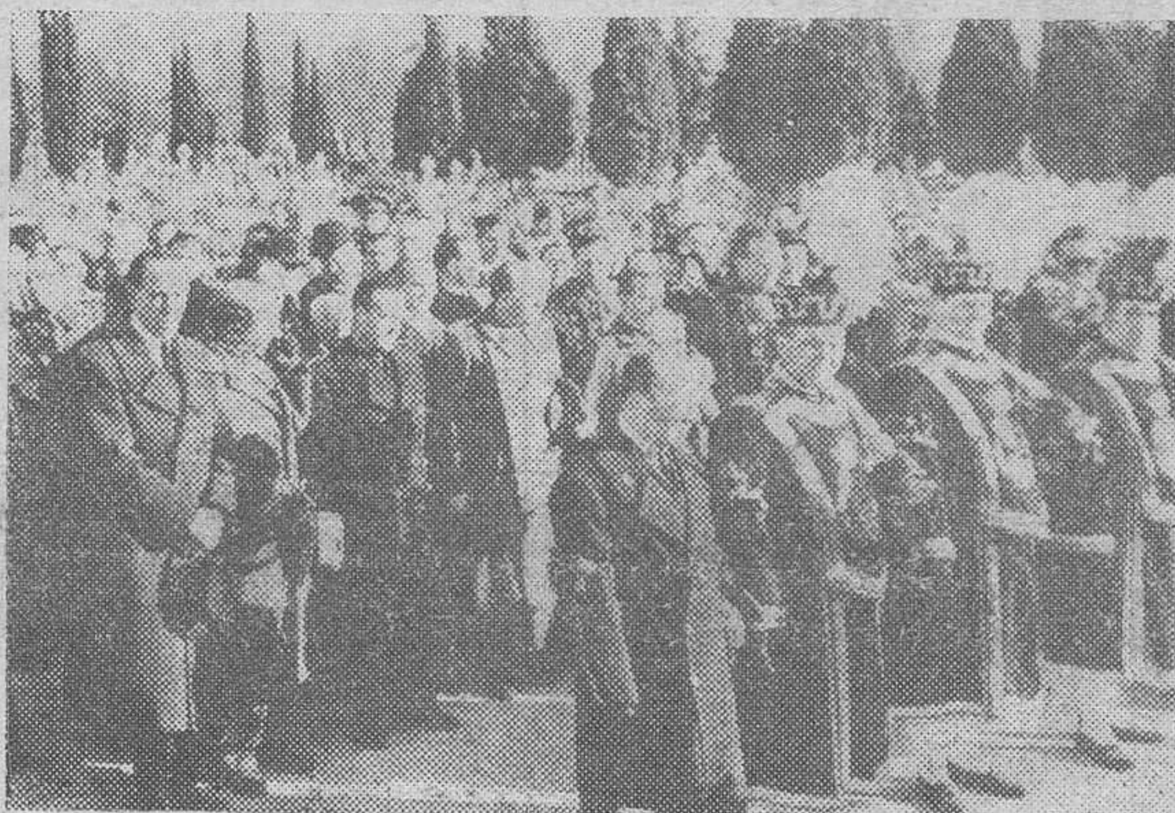
Un aspecto del entierro de las víctimas del hundimiento de la casa de la calle de Maldonado en Madrid