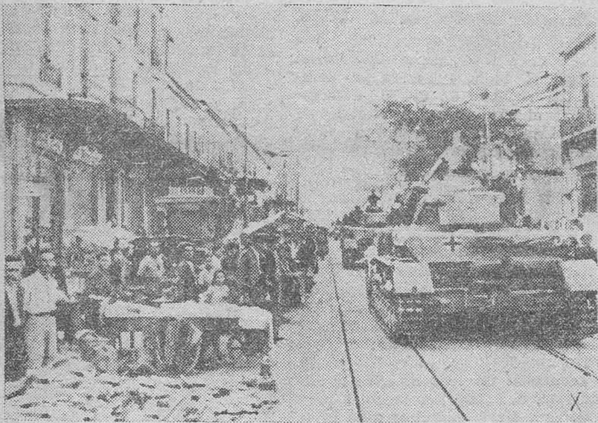
Una columna de tanques alemanes atraviesa una ciudad camino de la costa, para guarnecerla con vistas a una invasión aliada