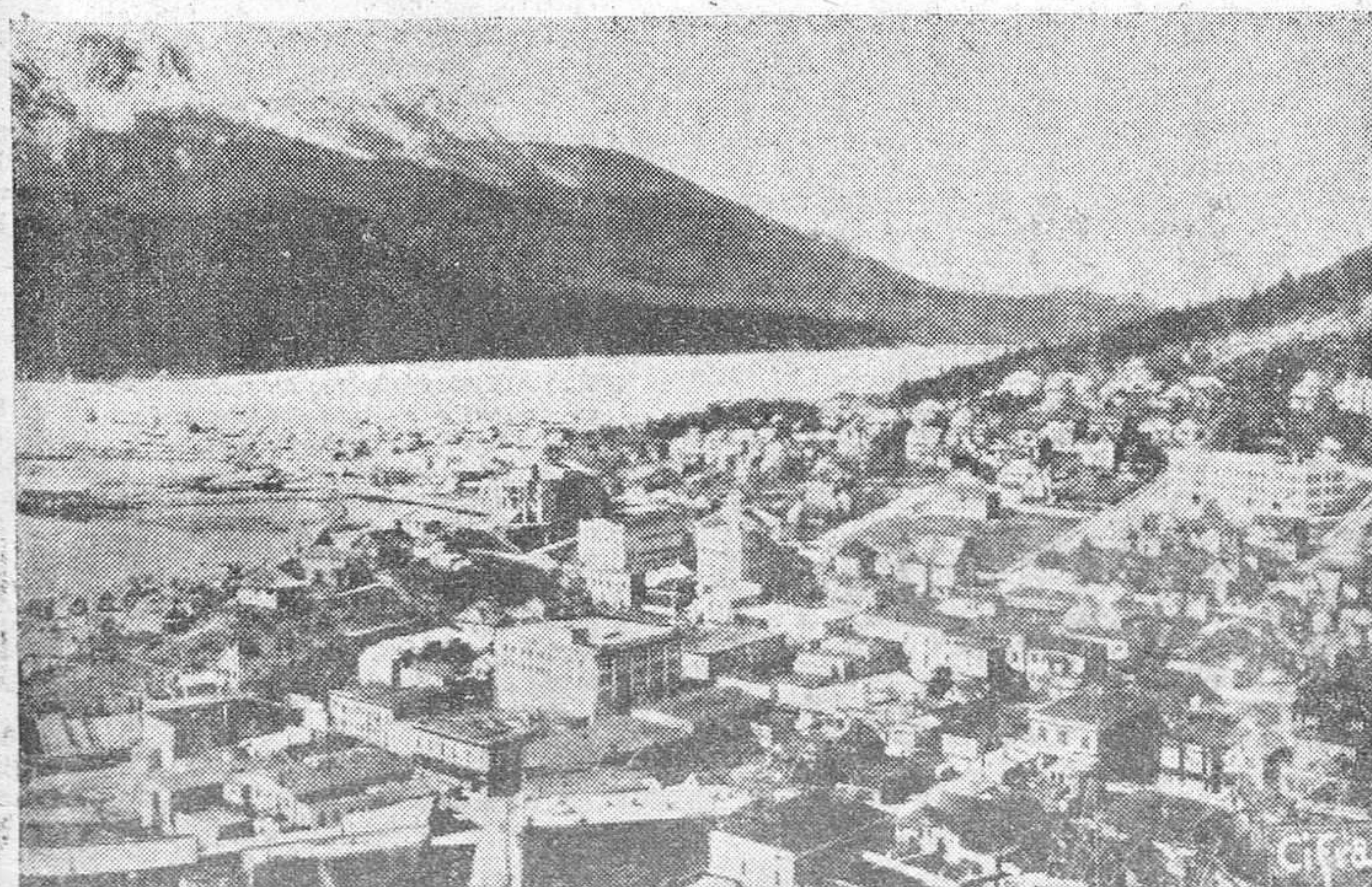
Vista de la ciudad y puerto de Juneau, capital de Alaska.