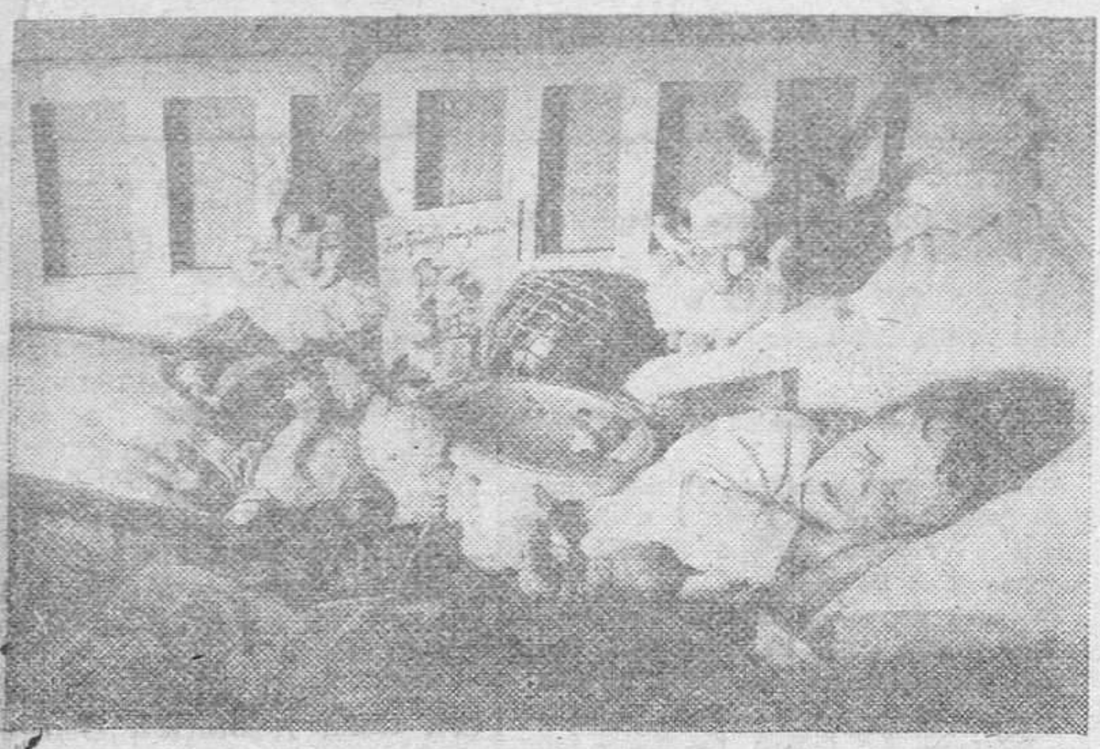
El sueño del niño en vísperas de Reyes