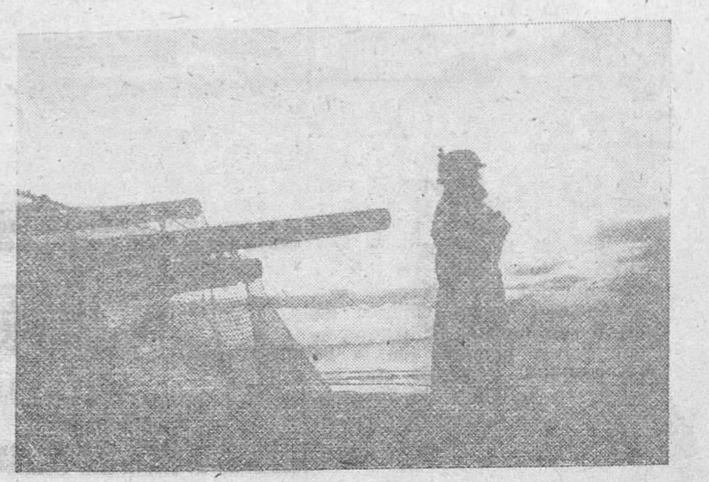
Guardia de Año Nuevo en la Costa francesa del Atlántico

Lo que se hace público a los efectos de la recaudación del impuesto citado con efectos para Hoteles, Pensiones, Restaurantes, etcétera.