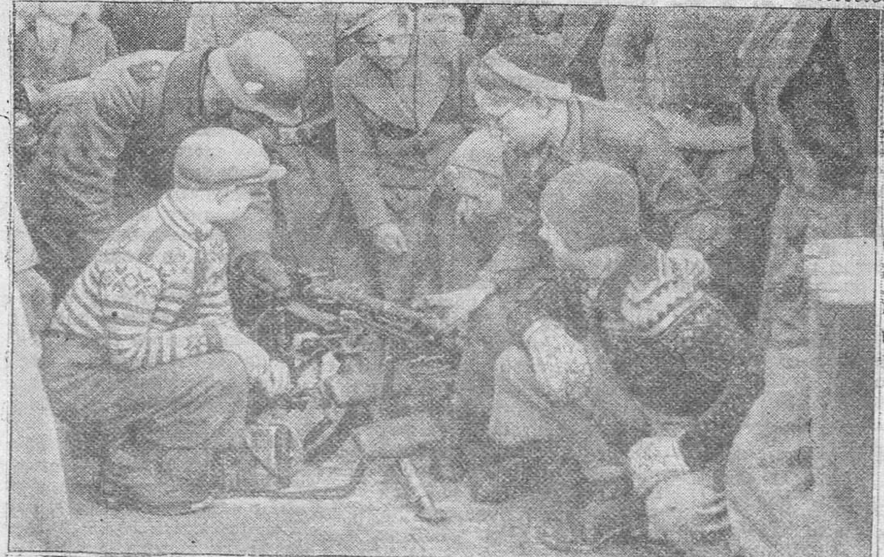
LOS NIÑOS Y LA GUERRA Los niños se interesan por todo. Estos muchachos abusan de la paciencia de unos soldados alemanes para abrumarles con preguntas sobre el manejo de una pequeña anaerofotografía.