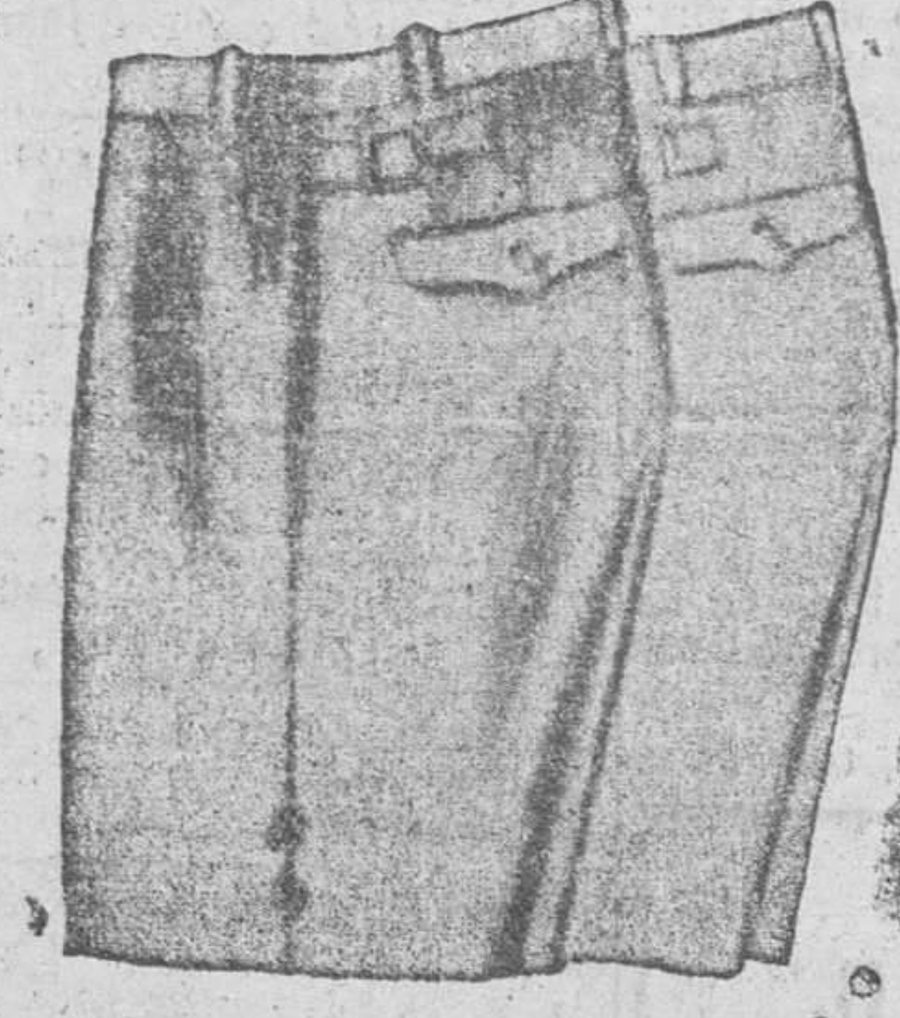
Pantalones pescador, para niño, en pana lisa negra, paño y patén. Pantalones y medias reglamentarios para «flechas».

Pr.mera casa en tejidos y confecciones para caballero, señora, jóvenes y niños PAÑERIAS - SASTRERIAS - CALZADOS SEGARRA