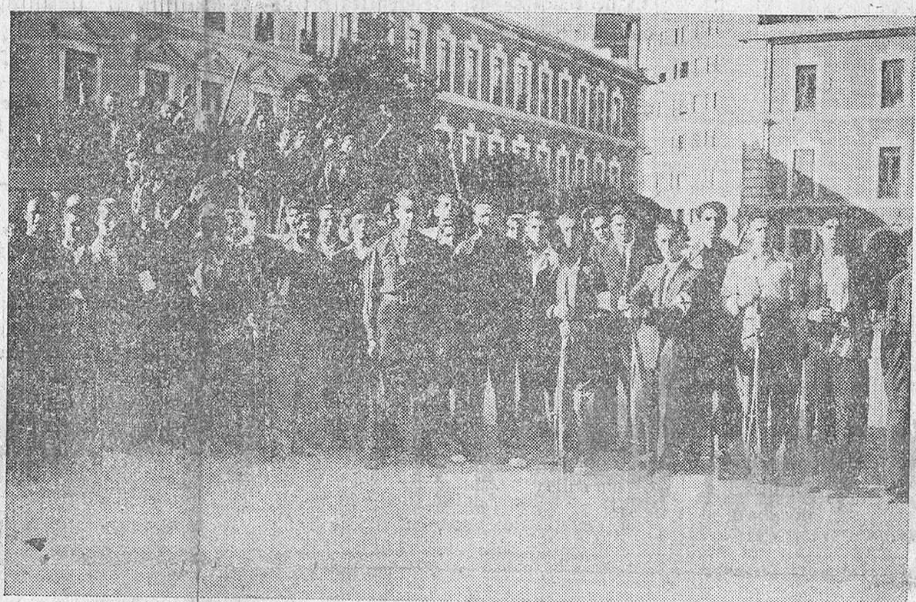
VALLADOLID.—Grupo de falangistas en su cuartel general con su jefe Onésimo Redondo, traidoramente asesinado

Estando pacificada casi toda aquella región, especialmente la provincia de Córdoba, no ha de encontrar obstáculos en su marcha ni en el Guadalquivir ni Sierra Morena, que son los únicos puntos en donde podrían encontrar resistencia, y una vez desembarcado en la llanura de la Mancha, la marcha debe ser franca y sin tropiezos.