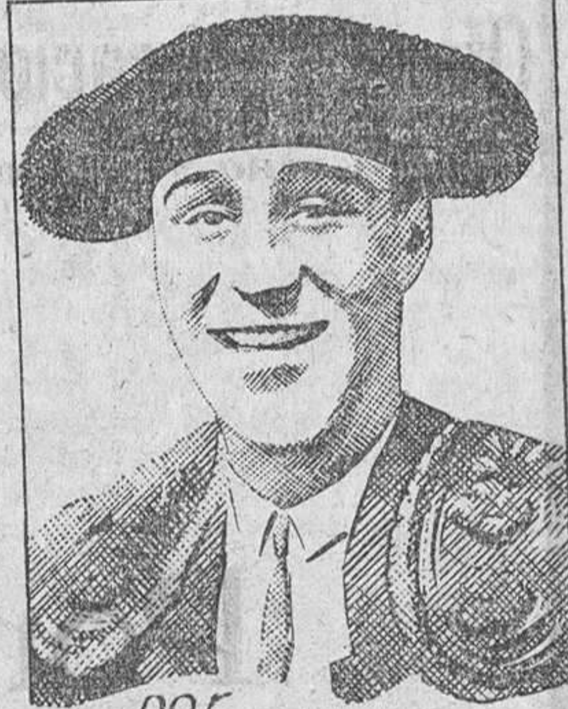
por FERNANDO DOMINGUEZ "El fino torero Vallisoletano"

«La mujer que me fascina»—escribe este valiente matador—«es la que tiene el cutis claro, fresco y juvenil. Ninguna mujer que tenga la cara manchada, terrosa y obscura, podrá esperar jamás atraer a ningún hombre. Las mujeres más hermosas del mundo me han hablado de un secreto de belleza que hace irresistible en seguida cualquiera piel. Este secreto se llama Crema Tokalon. Alimento de la Piel, Color Blanco. Suprime las imperfecciones de la piel, blanqueándola, aclarándola, y proporcionándole un frescor que ninguna otra cosa podría darle». La Crema Tokalon, Color Blanco, la famosa crema parisiense, contiene crema fresca y aceite de oliva predigeridos, mezclados con ingredientes que blanquean y aprietan la piel. Penetra hasta lo más profundo de los poros, y suprime las imperfecciones de la piel en donde éstas se forman. Las espinillas se disuelven y desaparecen por completo. Los poros dilatados se estrechan. En tres días, la Crema Tokalon, Color Blanco, le proporciona a Ud. una hermosa piel, nueva, blanca y fascinadora, que no se puede obtener con ningún otro medio. Nota: La Crema Tokalon Blanca, sin grasa, se vende ahora en tubos al precio de Ptas. 2,65 tamaño grande, y Ptas. 1,90, tamaño pequeño (tímbre incluido).