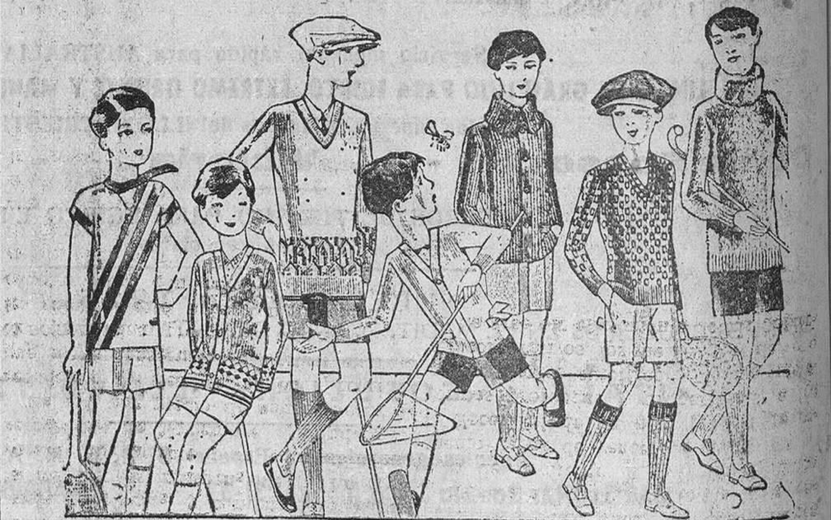
Jerseys punto, para niño, diversidad de dibujos y colores A 4, 5, 6, 7, 8 y 10 pesetas

en tejidos y confecciones para caballero, señora, jóvenes y niños. ANERIAS SASTRERIAS ALZADOS SEGARRA Mayor 47, Lado Chivo, 9 y 11.-Sucursal: Plaza Mayor, 8, Burgo