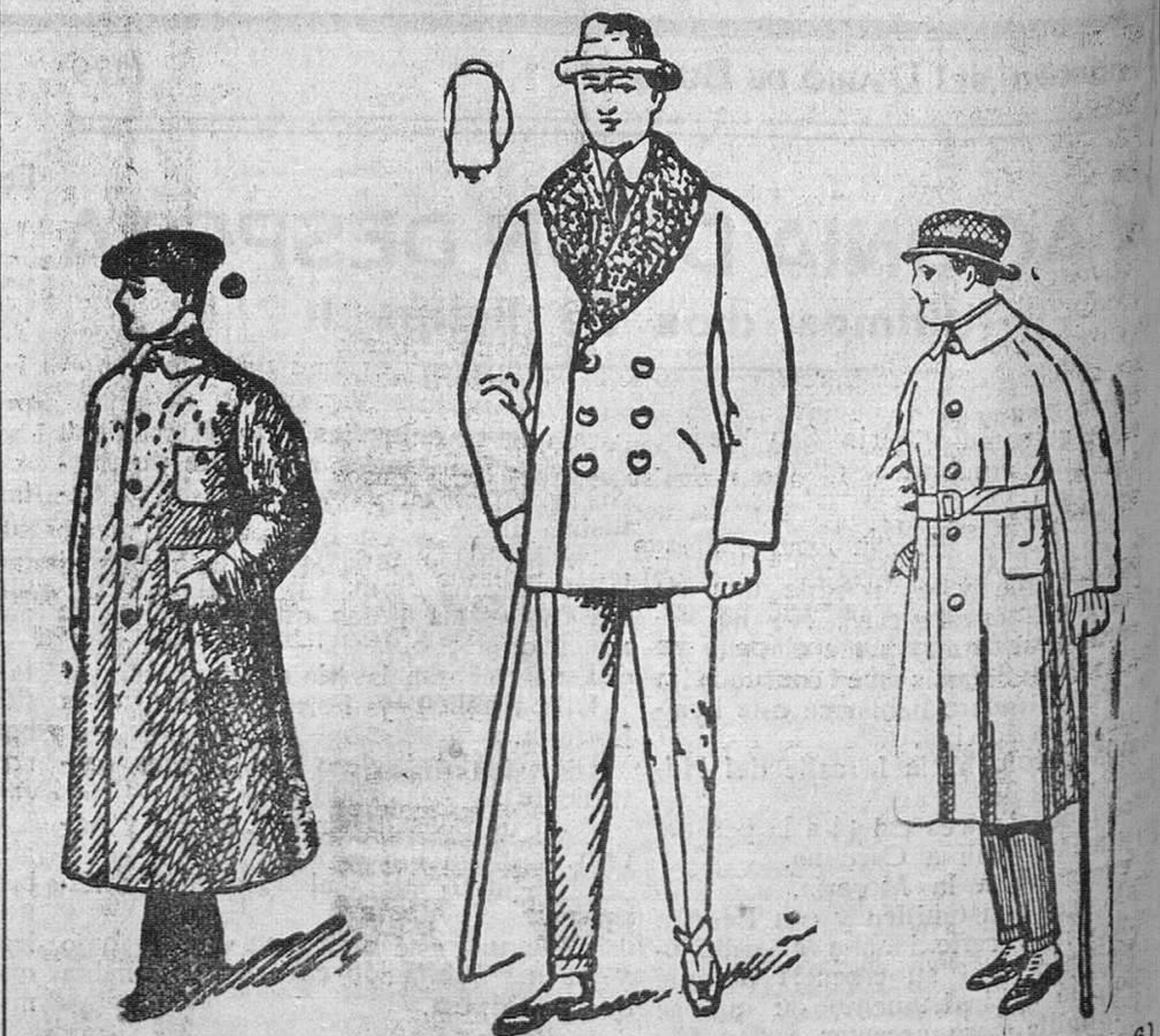
Pelizas niño, cuello rizo Gabardinas a 40, 50, 60 y 70 pesetas Guardapolvos de caballero a 18, 20, 25, 30, 40, 50 y 60 pesetas Impermeables de 25 a 40 pesetas

La casa que más barato vende y más surtido presenta