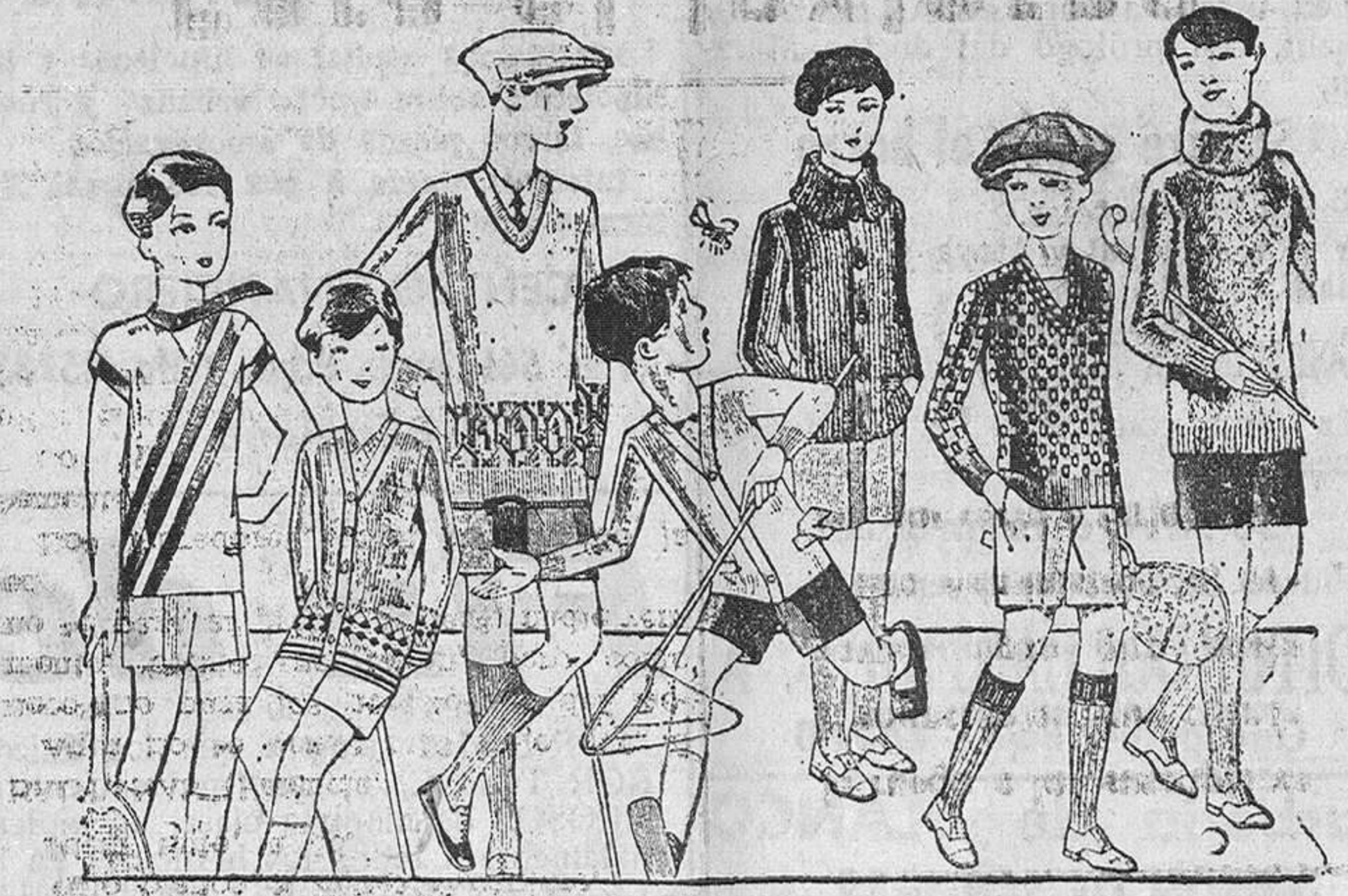
«Domingo Hospital» Gacetas punto, para niño, diversidad de dibujos y colores A 4, 5, 6, 7, 8 y 10 pesetas