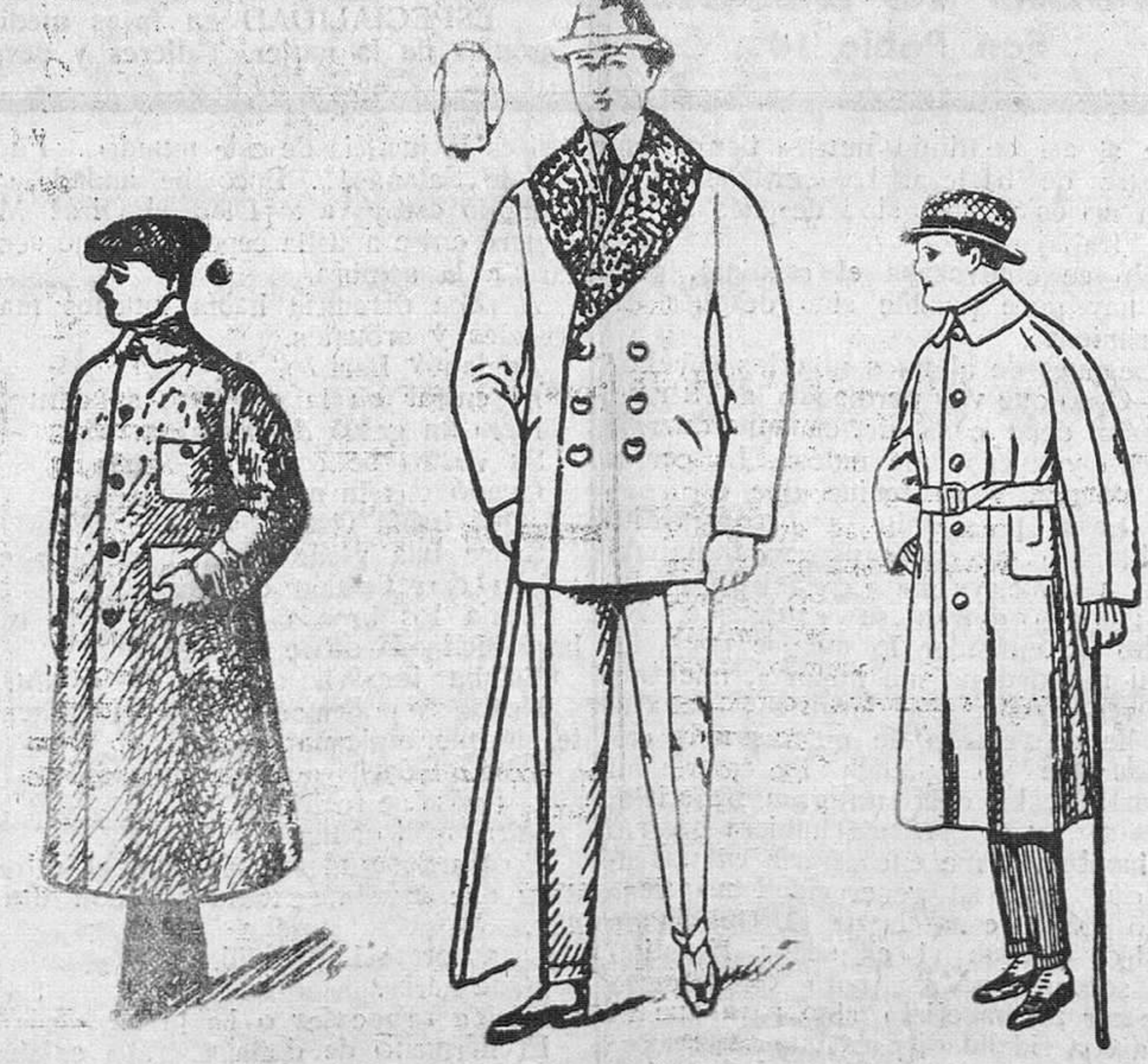
«Domingo Hospital» P. blusas paño, cuello rizo y 71 pesetas Gabardinas a 41, 5, 60 y 71 pesetas Guardapolvos de caballero a 18, 21, 25, 30, 40, 50 y 1 pesetas 75 pesetas Impermeables de 2 a 0

«Domingo Hospital» La casa que mas barato vende y más surtido presenta