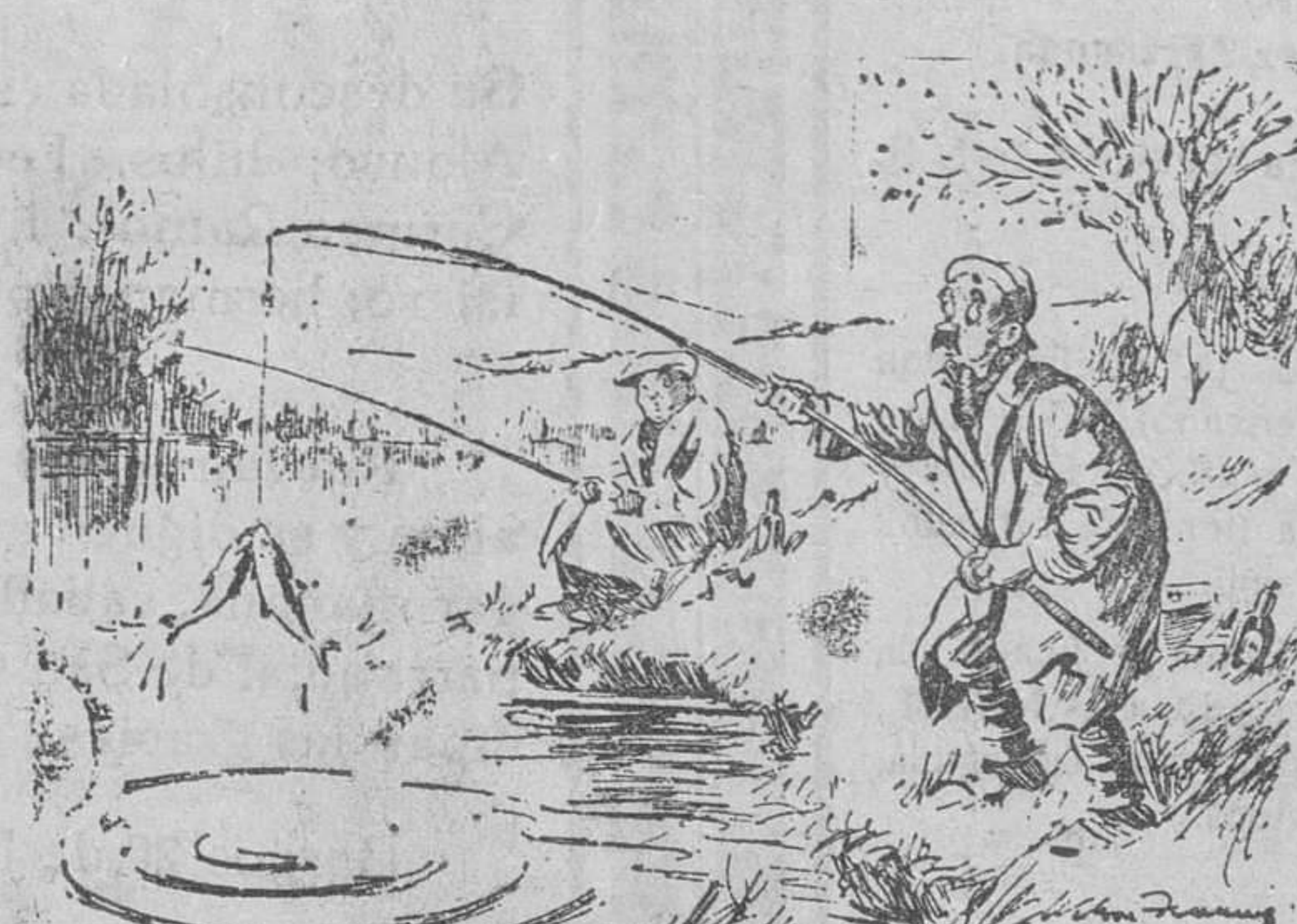
El pescador (que no suele ser muy afortunado).—Creo que se me ha subido el vino a la cabeza.

Aféitese a diario y use precisamente la novísima hoja «TOLEDO», modelo extrafino. Corte suave, persistente. Máxima flexibilidad y fuerza. Una estadística acusa que el promedio alcanzado con esta modernísima hoja es de once afeitados por hoja, y en algunos casos llega a servir durante un mes. Modelo corriente, 0'25. Modelo extrafino, 0'40. Ensayela. Es un producto de la Fábrica Nacional de Armas de Toledo. Esta es su máxima garantía y el cimiento de su fama.