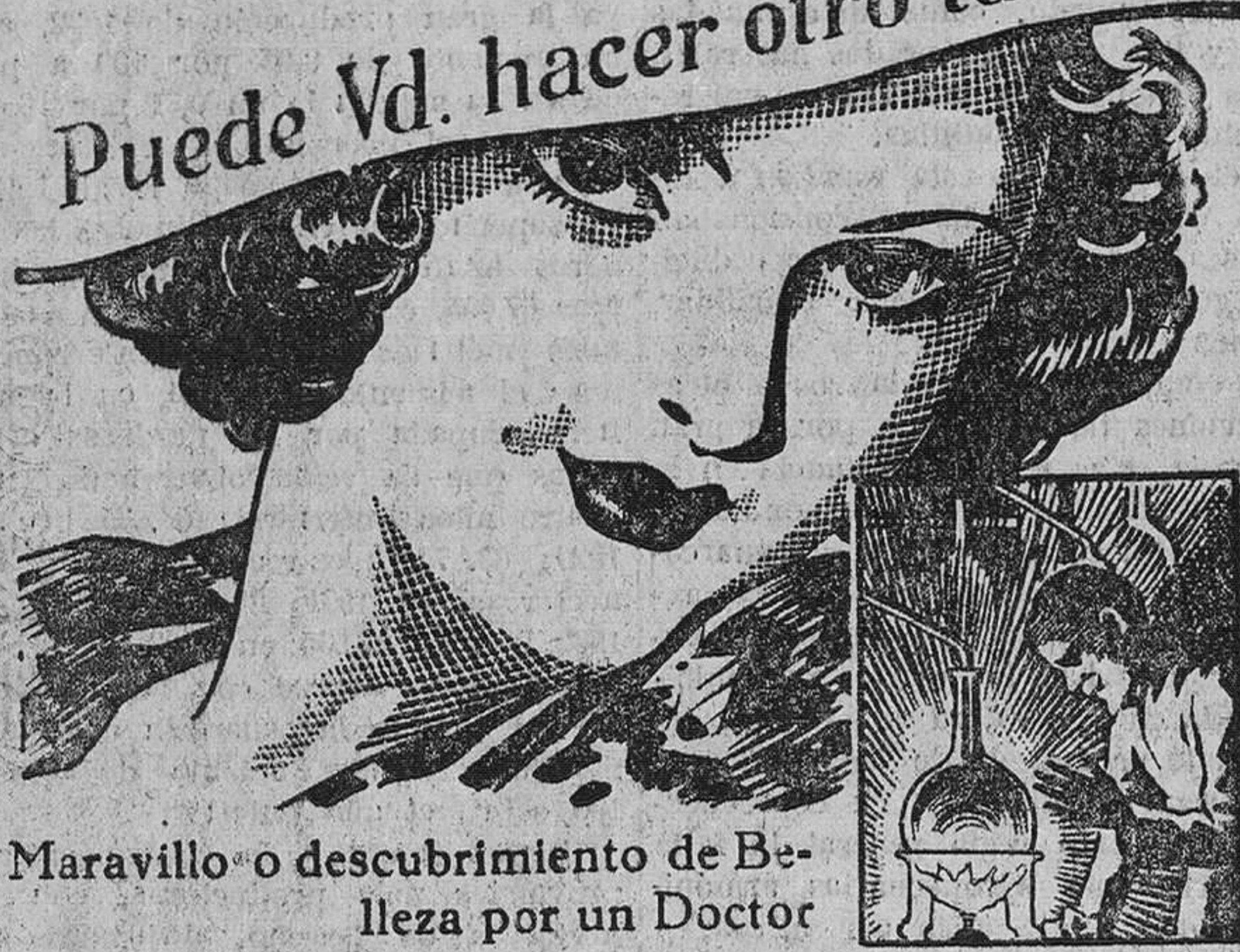
Maravilloso descubrimiento de Belleza por un Doctor

Es fácil, ahora, blanquear, refrescar y rejuvenecer una piel marchita y avieja. La Ciencia ha logrado descubrir el elemento vital y rejuvenecedor de la piel. Cuando, mediante un movimiento vibratorio, se le hace penetrar en la piel, las arrugas desaparecen, los poros dilatados, las espinillas e imperfecciones de la tez se disipan por completo. Este elemento vital y rejuvenecedor, obtenido de animales jóvenes, está contenido ahora únicamente en la nueva Crema Tokalon, la famosa crema parisiense. La acción tónica y embellecedora que dicho elemento ejerce sobre la piel produce ese esplendor de salud y de juventud que surge de los tejidos subcutáneos y proporciona al rostro, por feo que sea, la belleza más sorprendente.