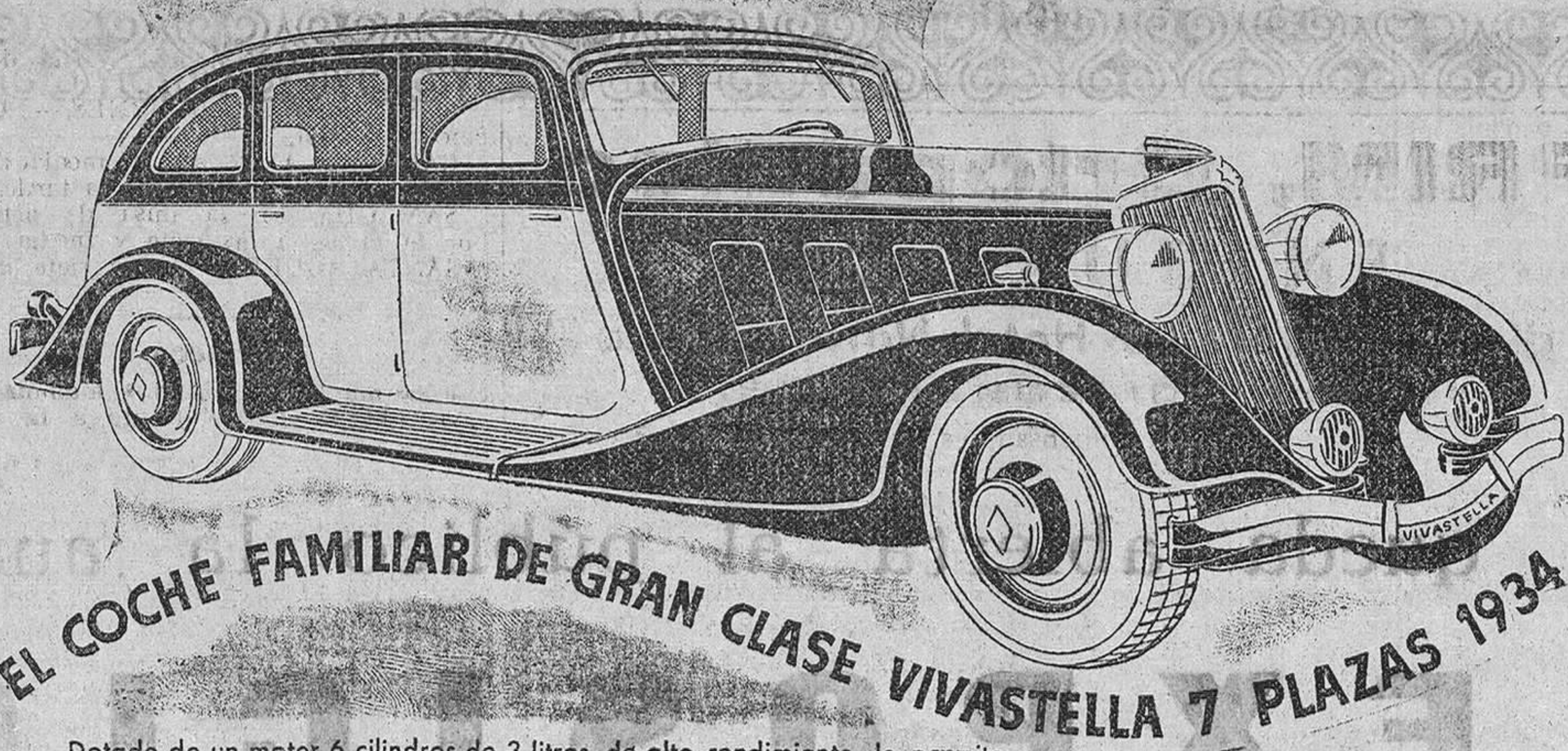
EL COCHE FAMILIAR DE GRAN CLASE VIVASTELLA 7 PLAZAS 1934