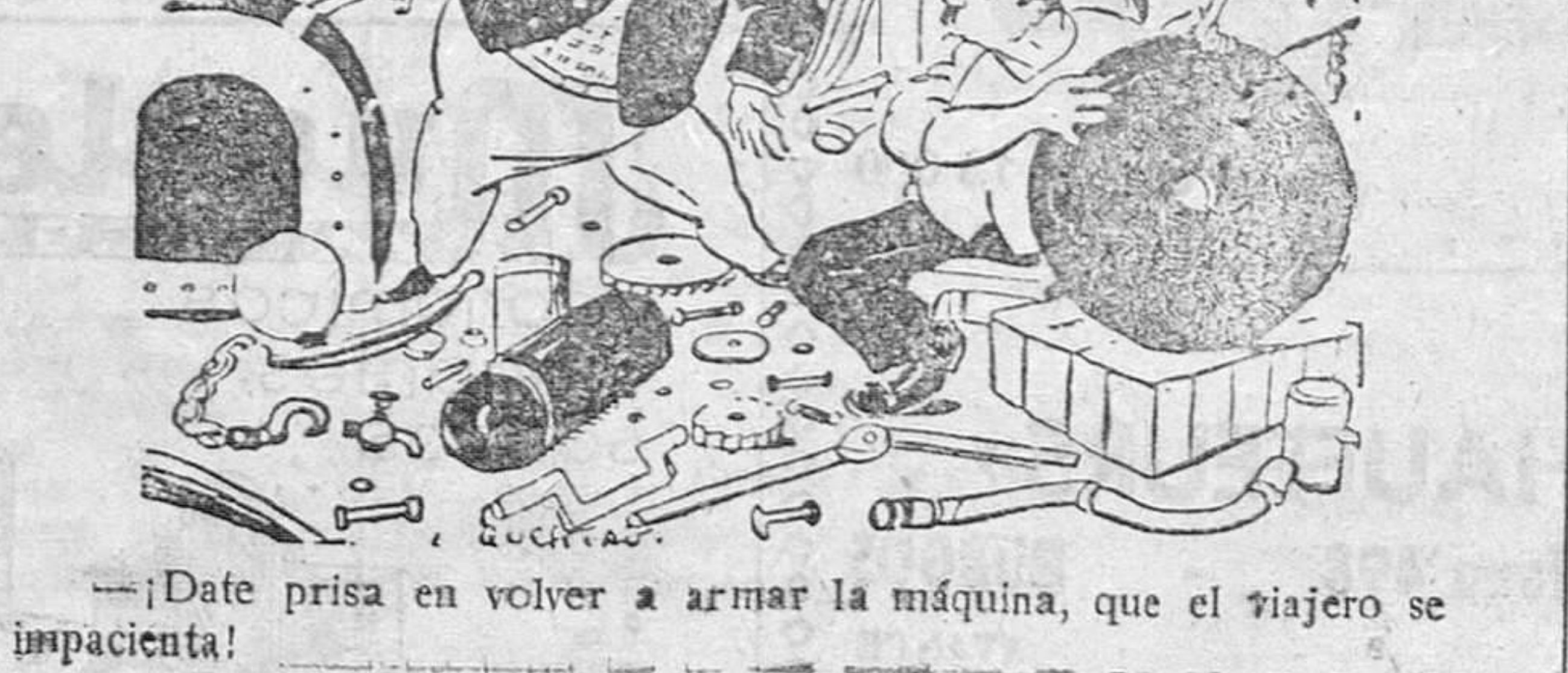
—¡Date prisa en volver a armar la máquina, que el viajero se impacienta!