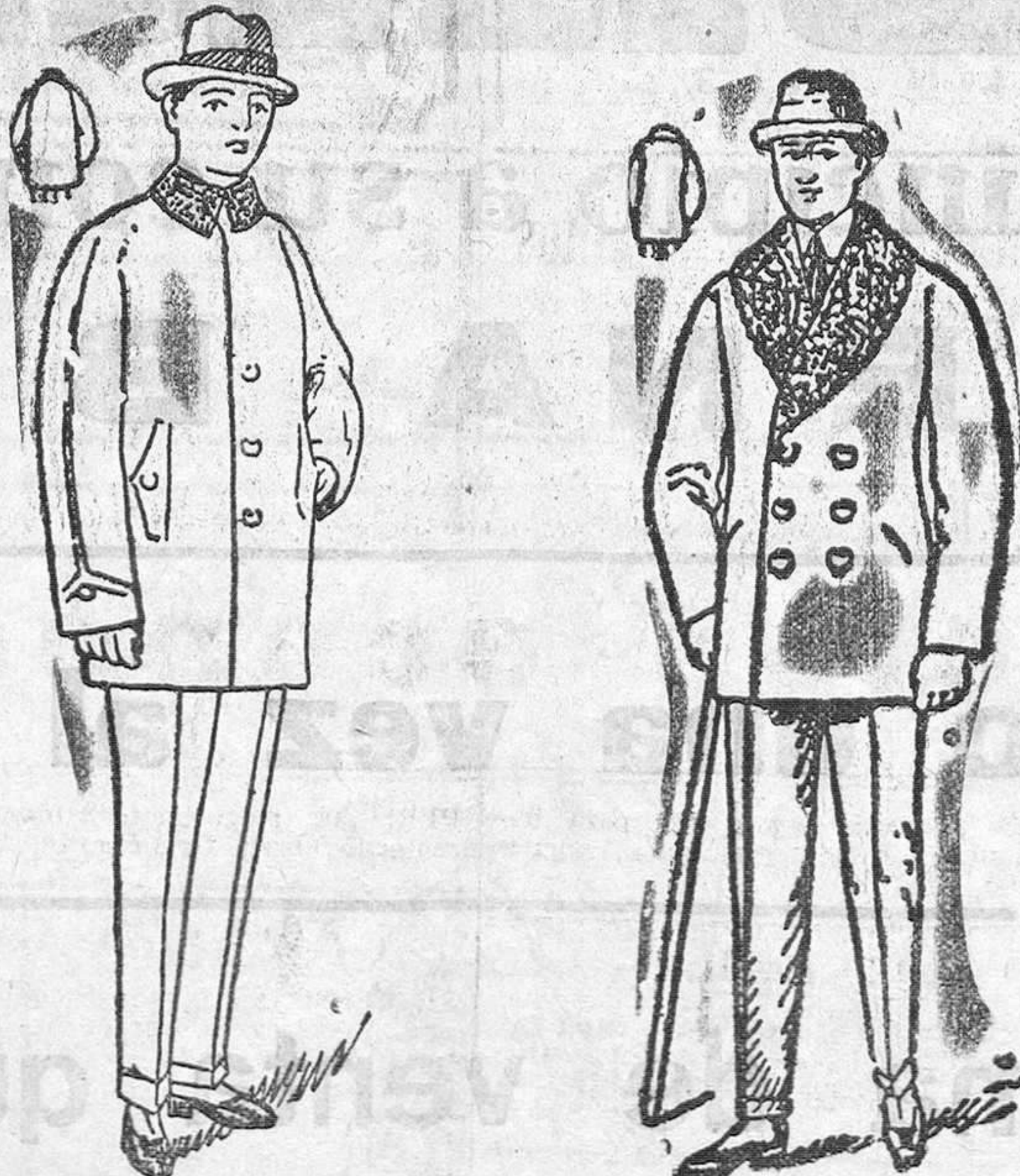
Pellicas paño, cuello rizo, de 20 a 110 pesetas. Pellicas paño, cuello rizo o astracán, de 20 a 75 pesetas.

Primera casa en confecciones para señora, caballero y niño. Plaza Mayor, 42, Lain-Calvo, 9 y 11.—Sucursal: Plaza Mayor, 5, Burgos. Teléfono, 603-R. Teléfono, 284.