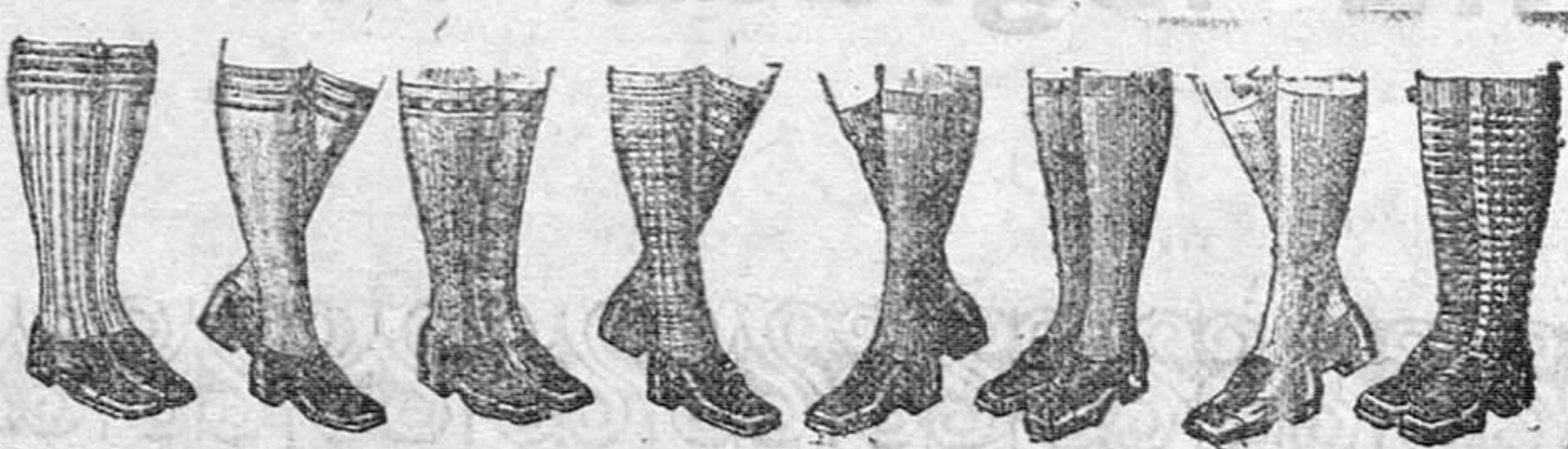
Medias de Sport, todas las medidas, dibujos novedad, de 1 a 5 pesetas. 1,00 jerseys con cremallera para niños, de 3 a 10 pesetas.