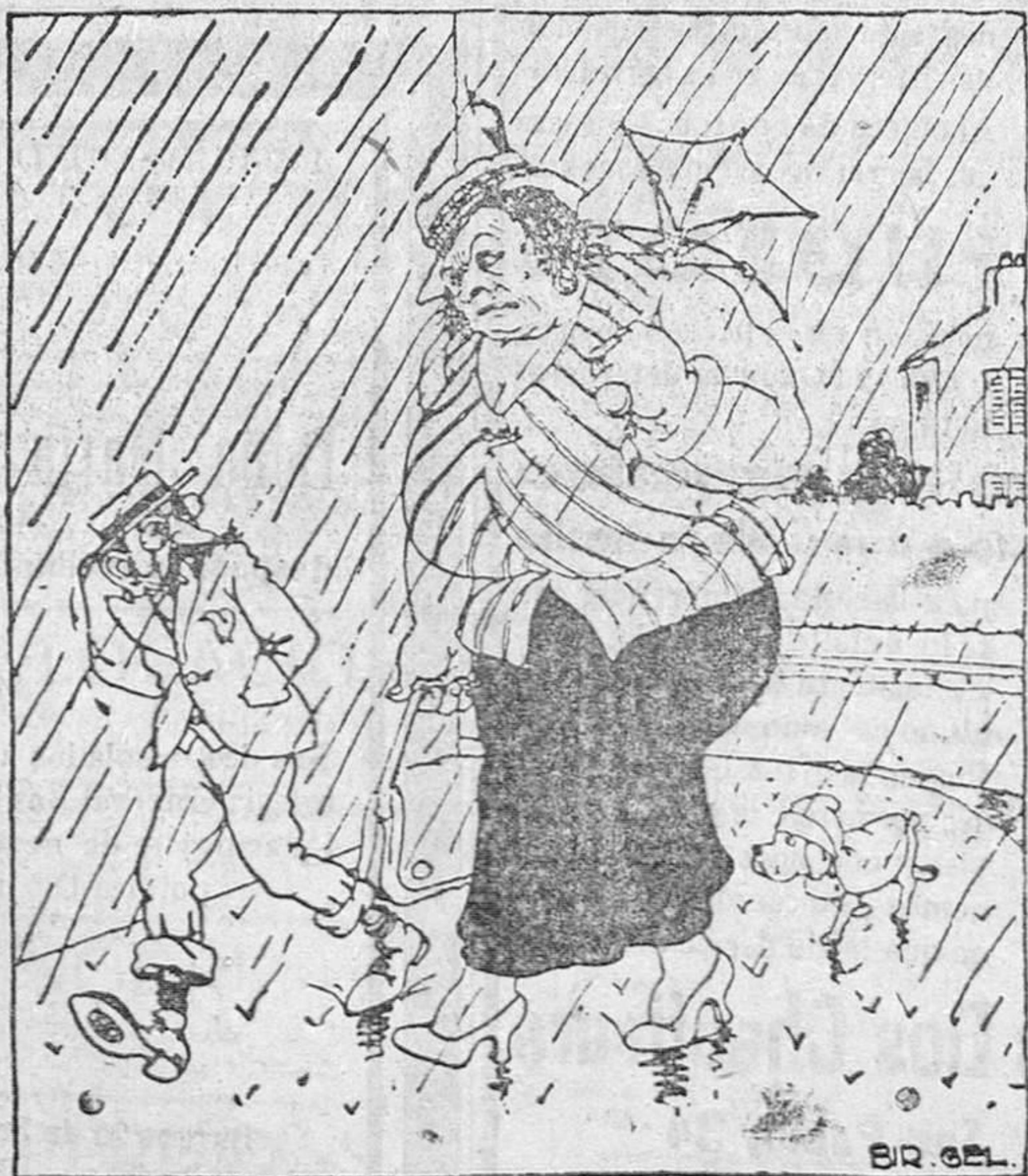
Ella.—Siempre te ocurre igual. ¡Te empeñas en salir de casa sin paraguas!

SE LES ADVIERTE QUE NO SE DEVUELVEN LOS ORIGINALES NI SE SOSTIENE CORRESPONDENCIA