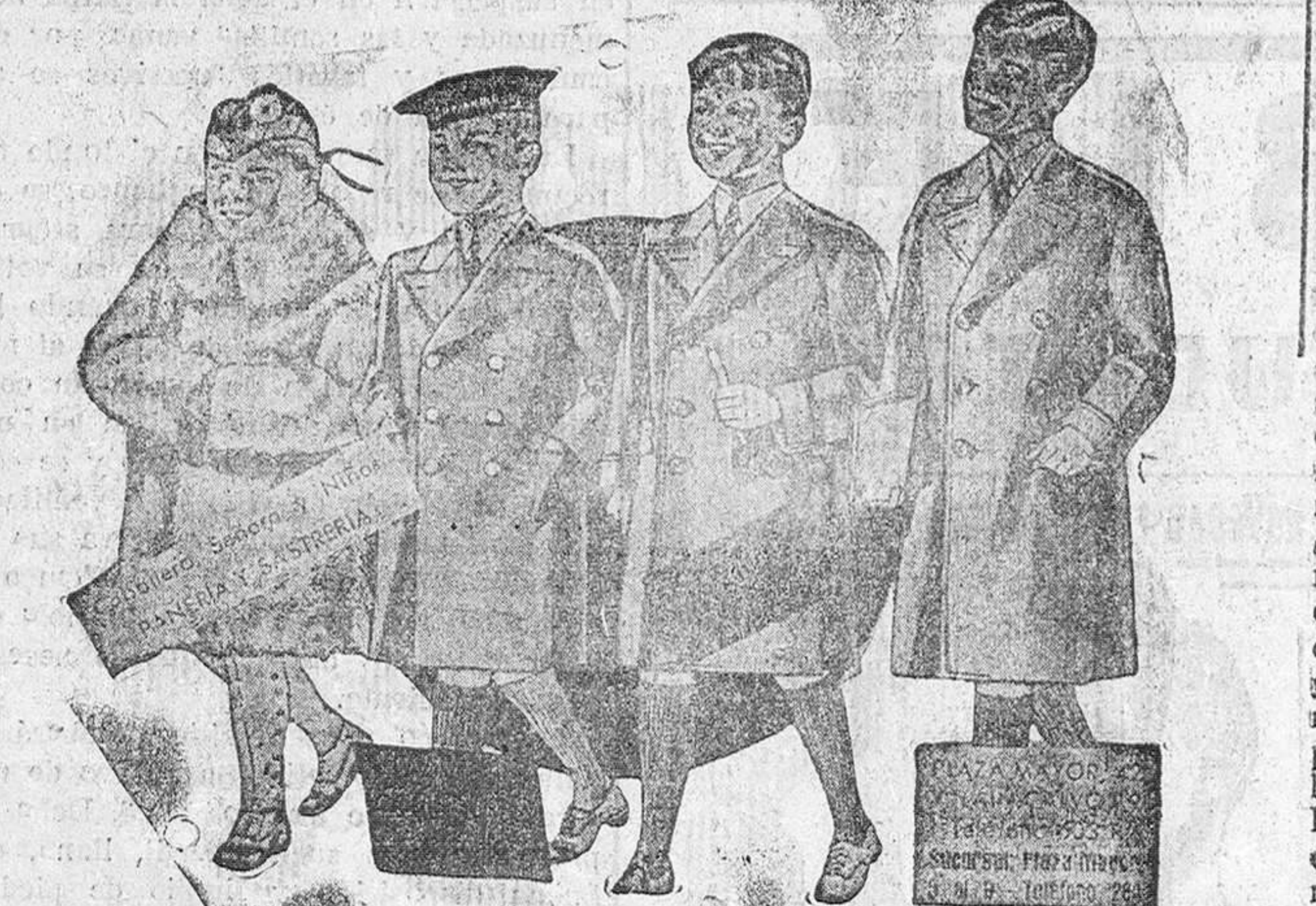
Abriguitos para niños, modelos nove dalt, de 15, 18, 20, 25 y 30 pesetas

Primera casa en confecciones para caballero, señora y niño. Plaza Mayor, 49, LAIN-CAIVO, 9 y 11.—SUCURSAL: Plaza Mayor, 8, BURGOS