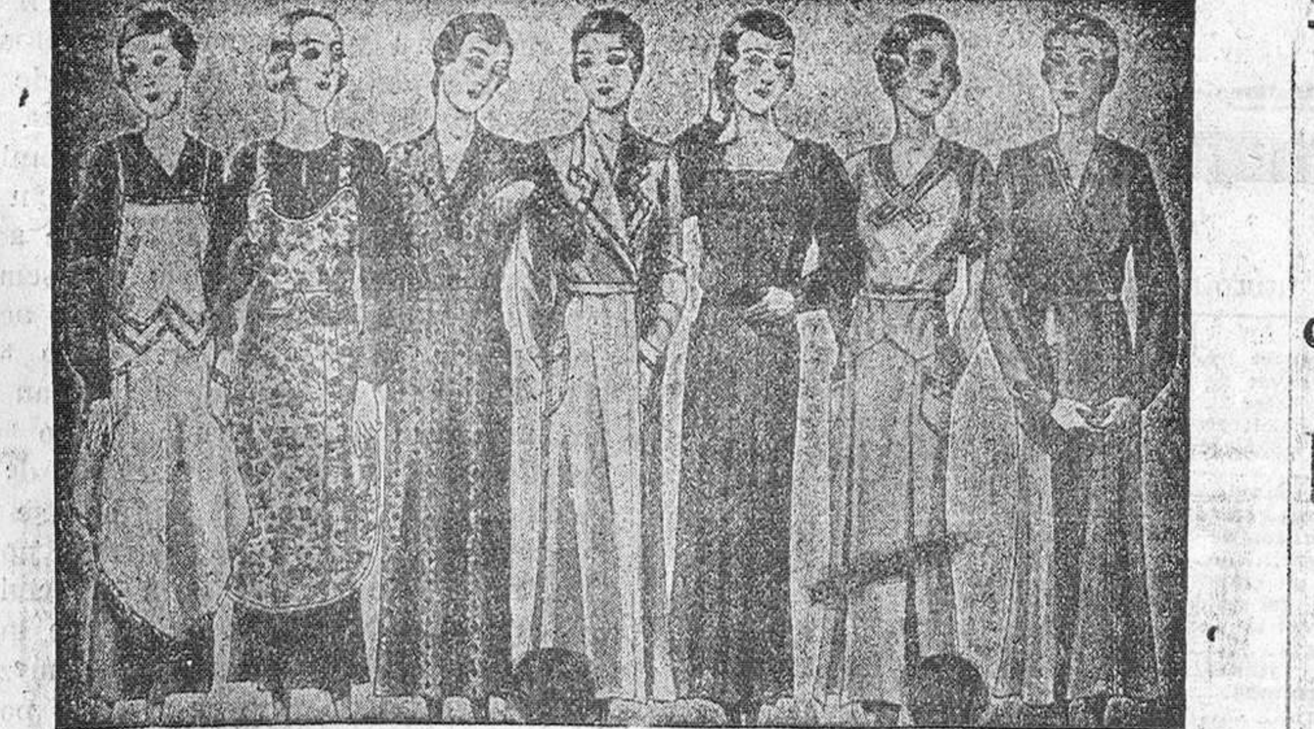
Batas y uniformes, todos los gustos, diversidad de modelos, de 8, 10, 12 y 15 pesetas.

La casa que más surtido presenta y más barato vende