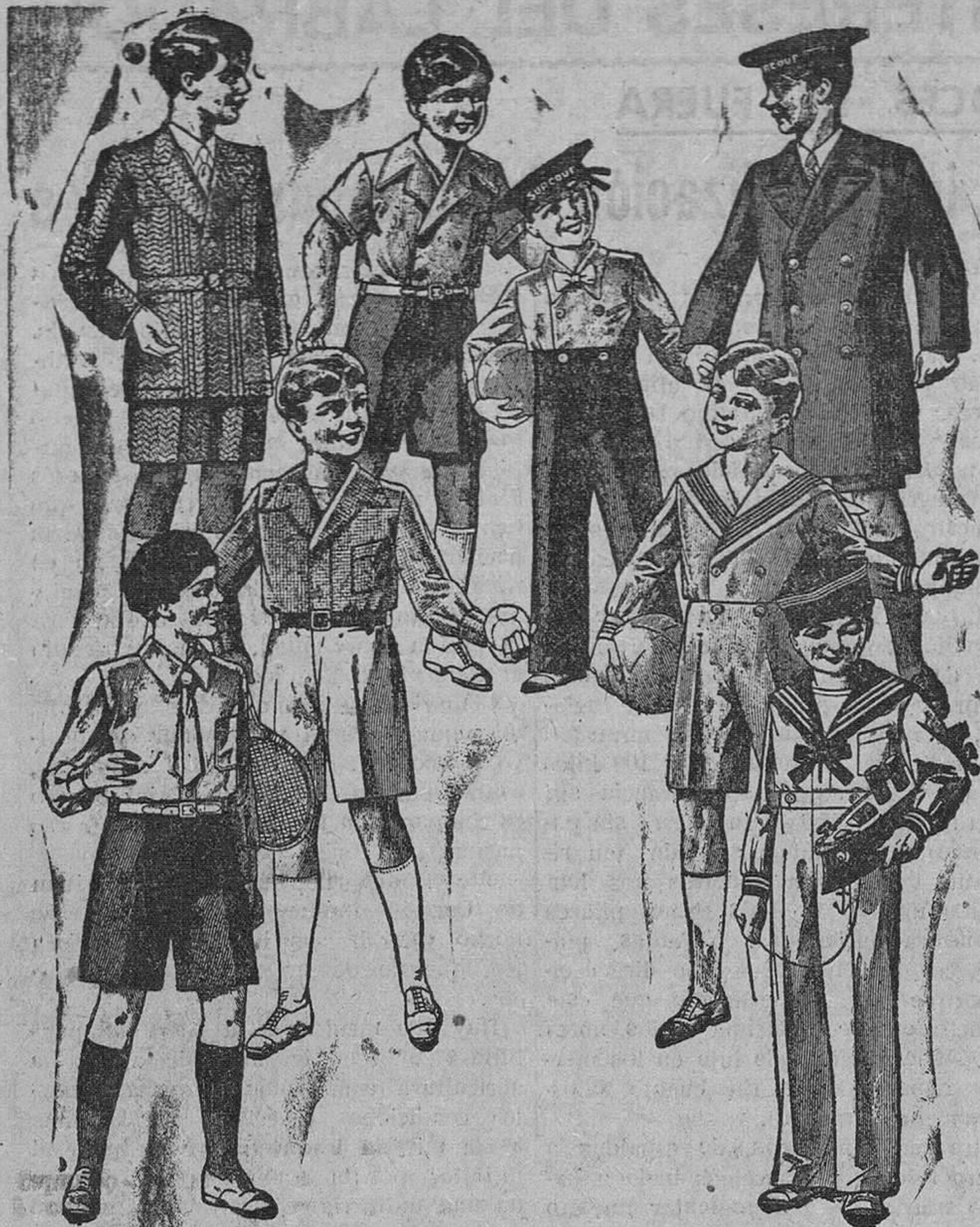
Trajecitos, modelos novedad, de 15, 18, 20, 25 y 30 pesetas La Casa que más surtido presenta y más barato vende

Primera casa en confecciones para caballero, señora y niños Plaza Mayor, 41. Lain-Calvo, 9 y 11.—Sucursal: Plaza Mayor, 6, Burgos Teléfono, 603-R — Teléfono, 284