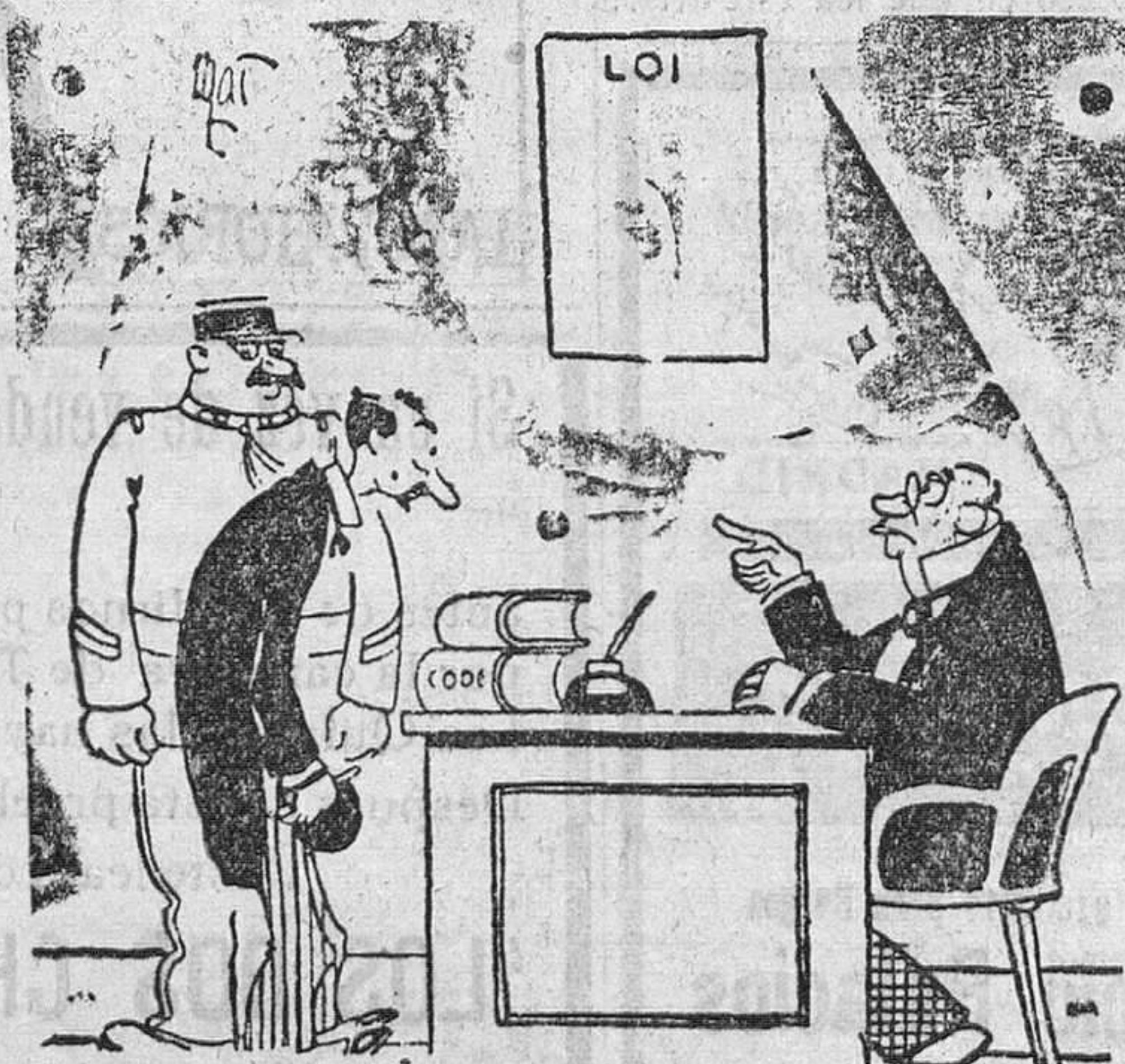
—Se le acusa de haber tenido una sala de juegos de azar. —Perdón, señor juez; era una agencia matrimonial. —Es lo mismo.

La Junta estudiará, igualmente, el acoplamiento de la actual plantilla de generales, jefes y oficiales, dictando normas para que los que resulten excedentes no sufran perjuicios.