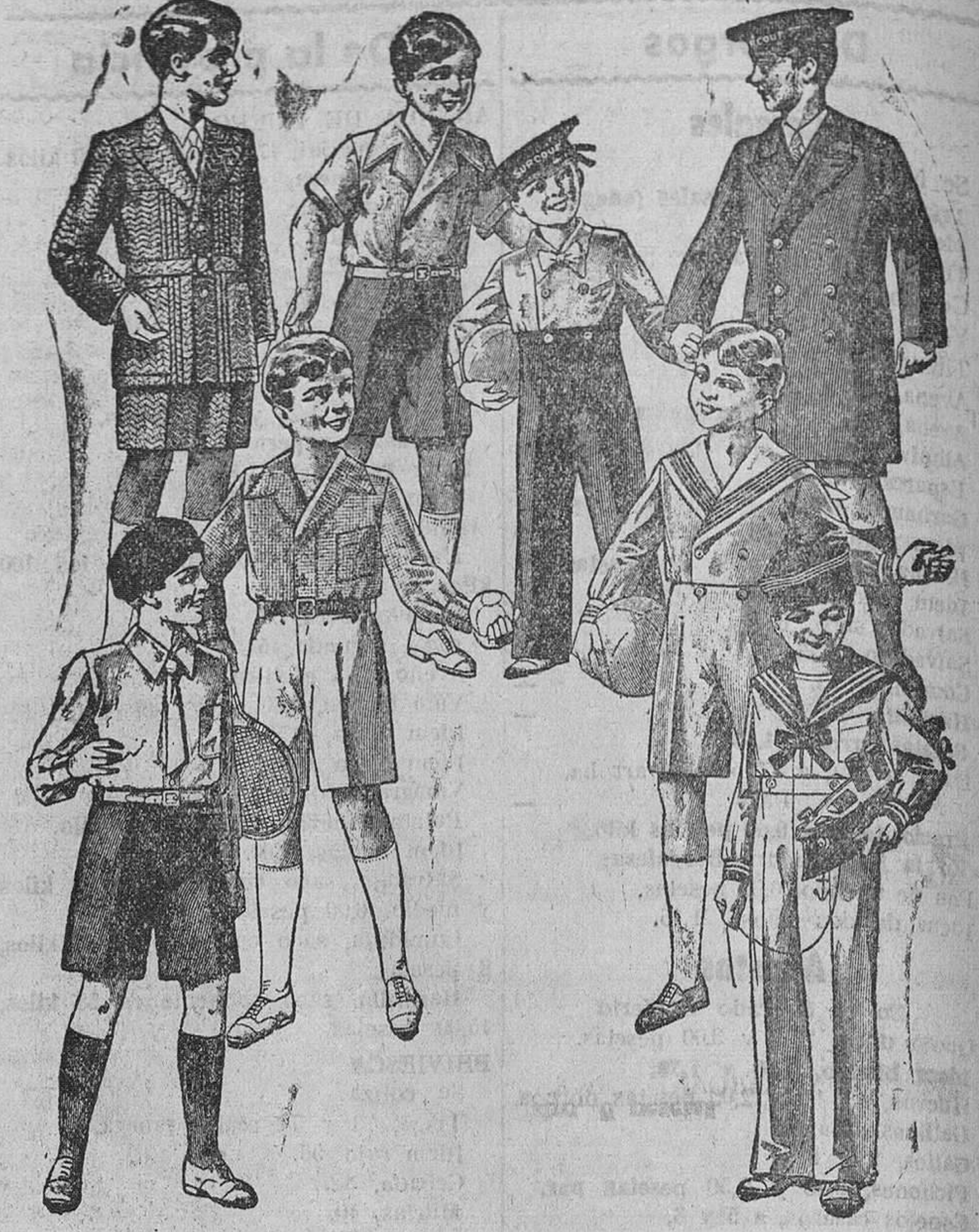
Trajecitos, modelos novedad, de 15, 18, 20, 25 y 30 pesetas

Primera casa en confecciones para caballero, señora y niño. Plaza Mayor, 42, Lain-Calvo, 9 y 11.—Sucursal: Plaza Mayor, 8, Burgos. Teléfono, 603-R. Teléfono, 284