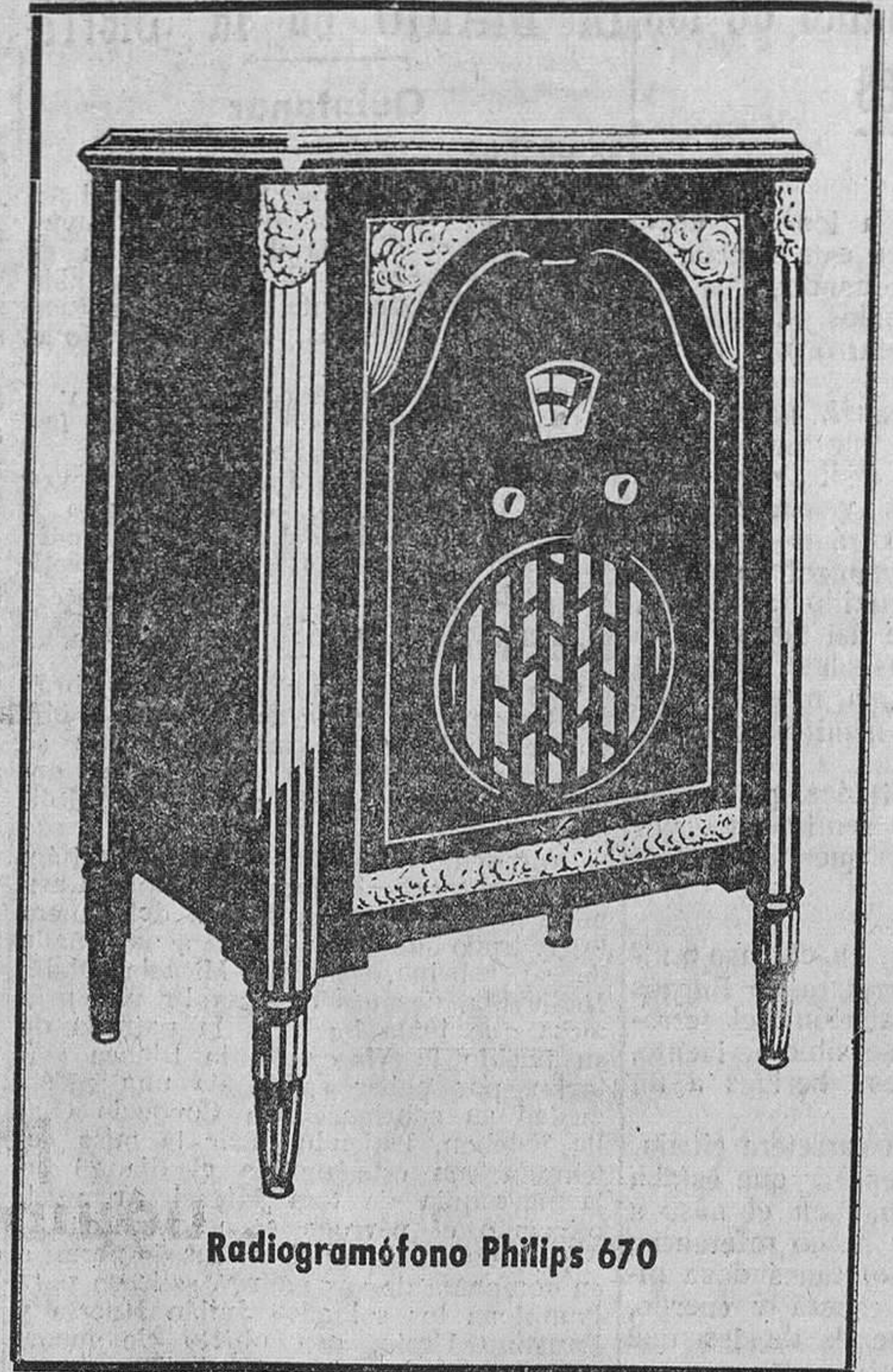
Radiogramófono Philips 670

Oiga los nuevos modelos en la Representación oficial de