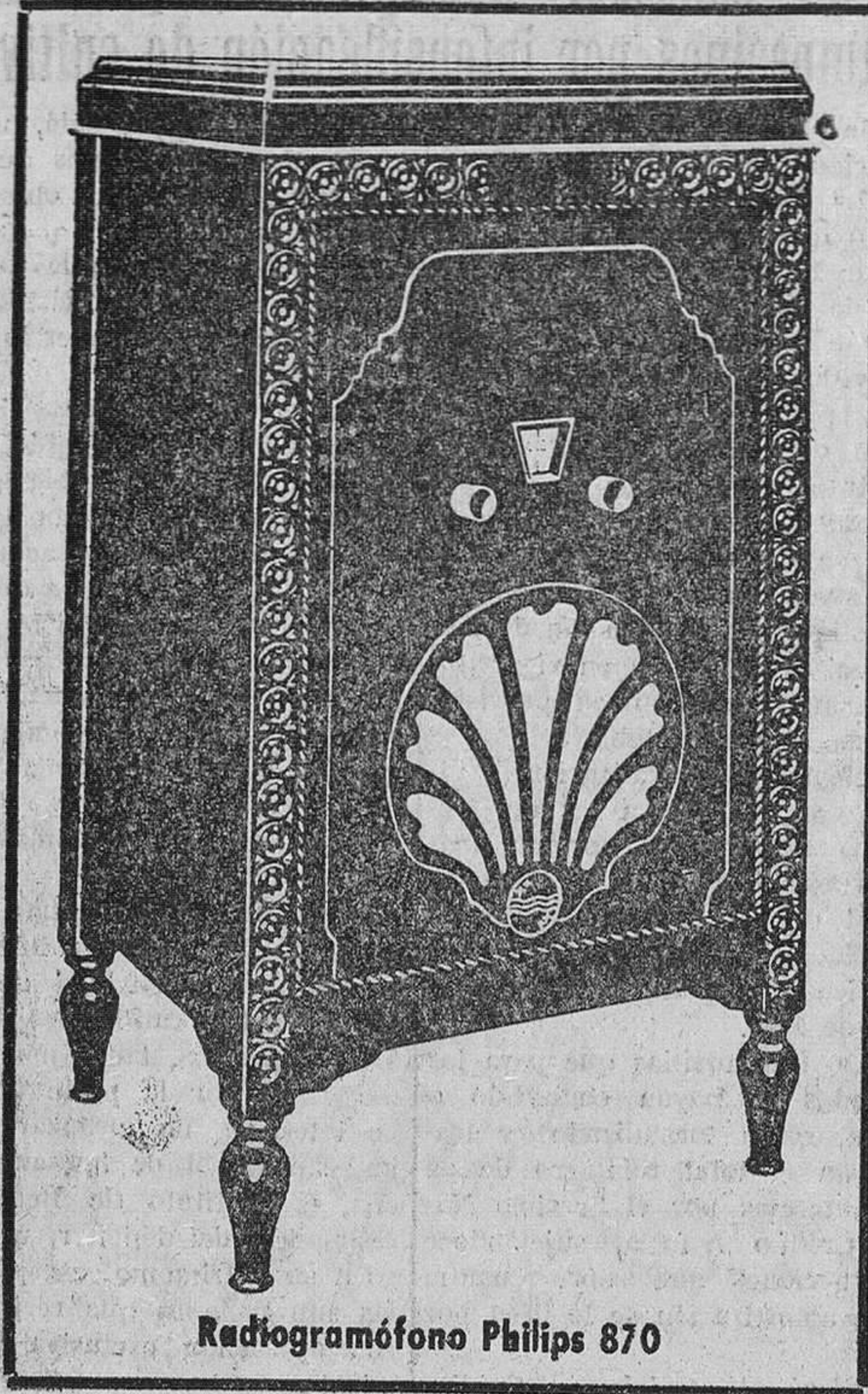
Radiogramófono Philips 870