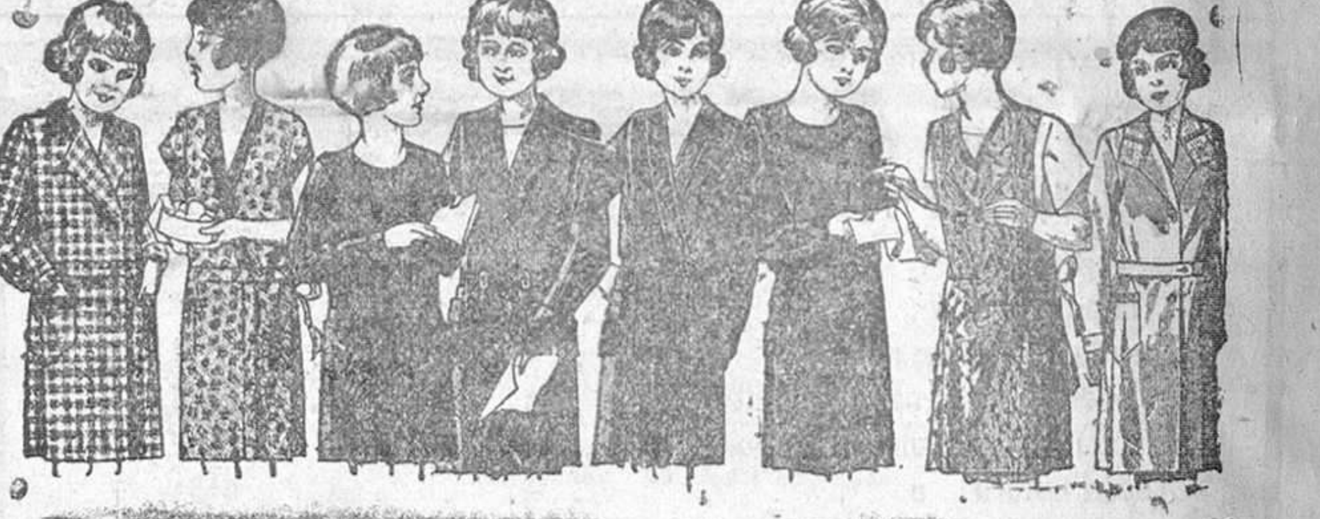
Vestiditos para niñas de 8 a 14 años, en crepón, seda o lana, de 12, 15, 18, 20 y 25 pesetas.

La Casa que más surtido presenta y más barato vende