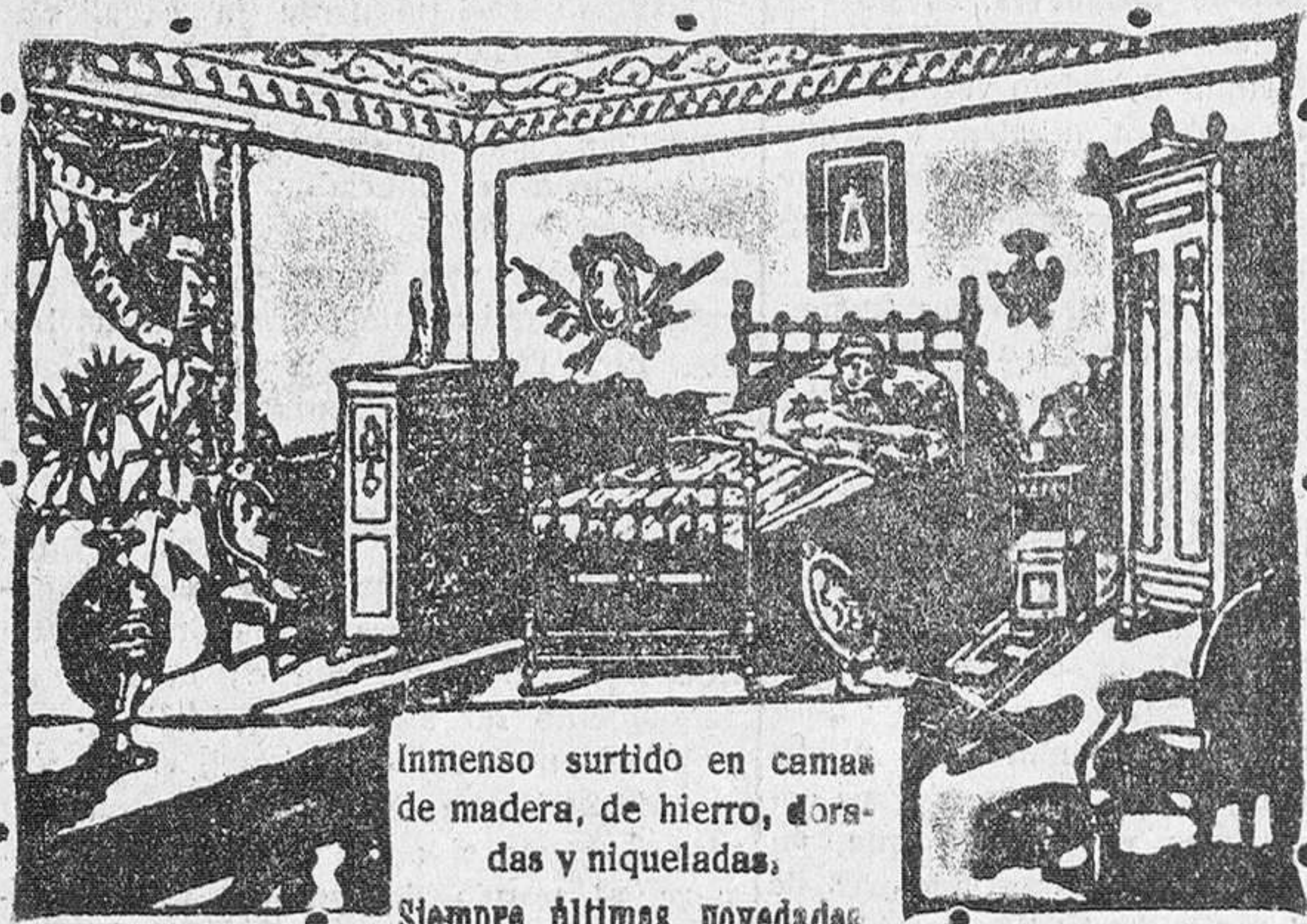
Vea el nuevo sommier, todo hierro, modelo patentado. Es muy limpio, fortísimo y muy económico.

Inmenso surtido en camas de madera, de hierro, doradas y niqueladas. Siempre últimas novedades.