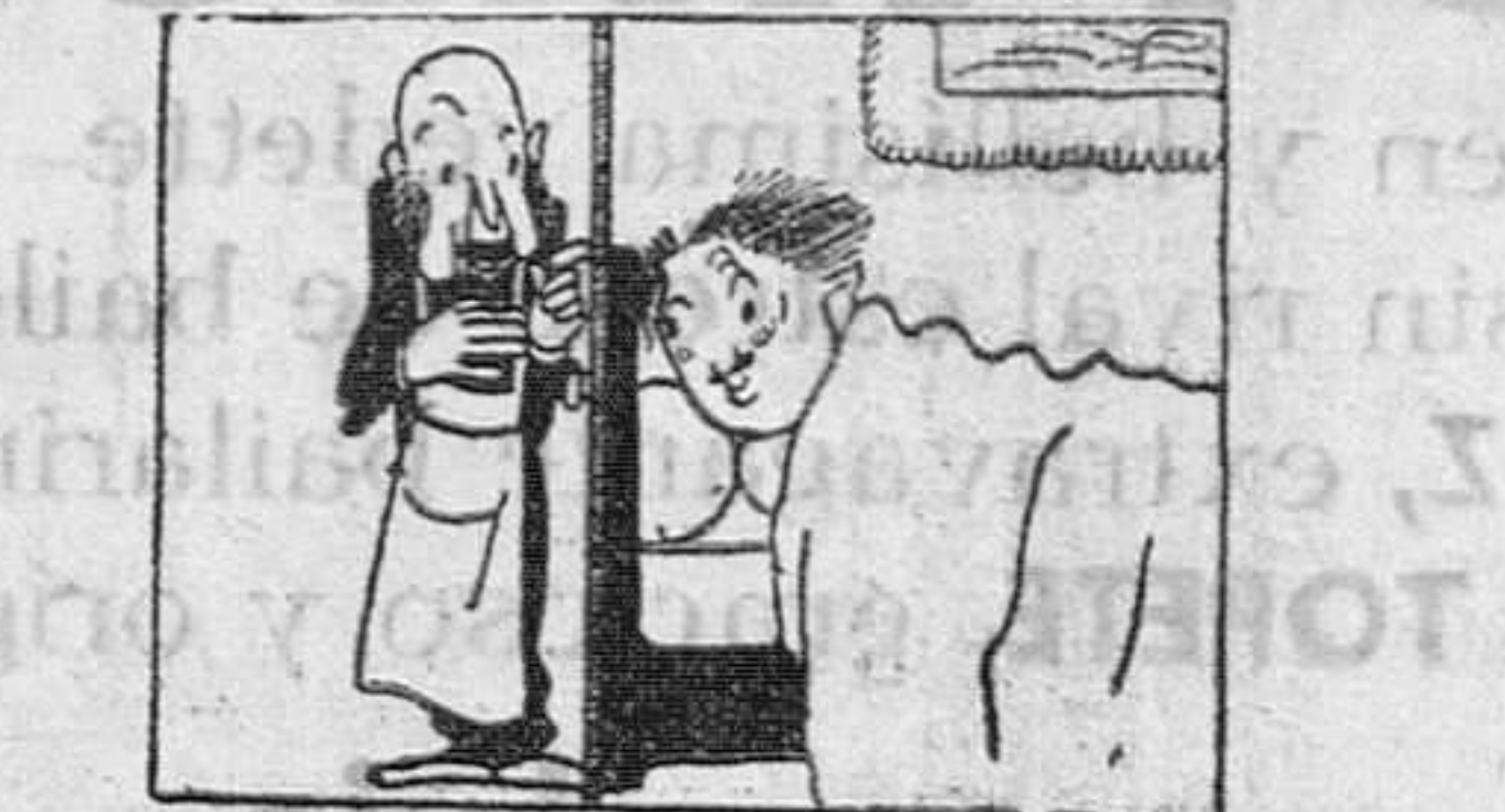
—Perdone, señor; no me acuerdo si tenía que llamarle a las seis o a las ocho.

CASA SAIZ Calle de la Sombrería, número 4-BURGOS.