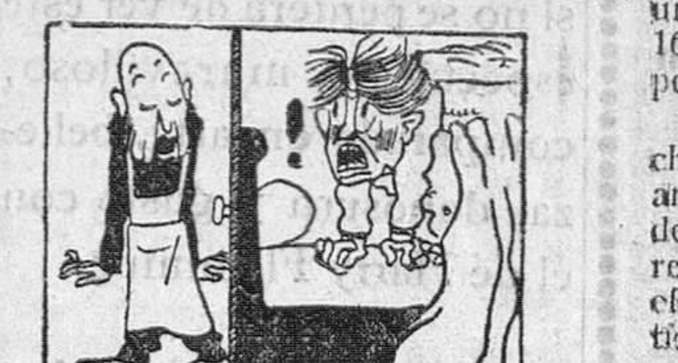
—¿Ahora? ¡Las nueve!