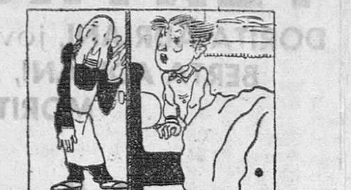
—¡No, hombre! ¡A las seis! ¿Qué hora es?