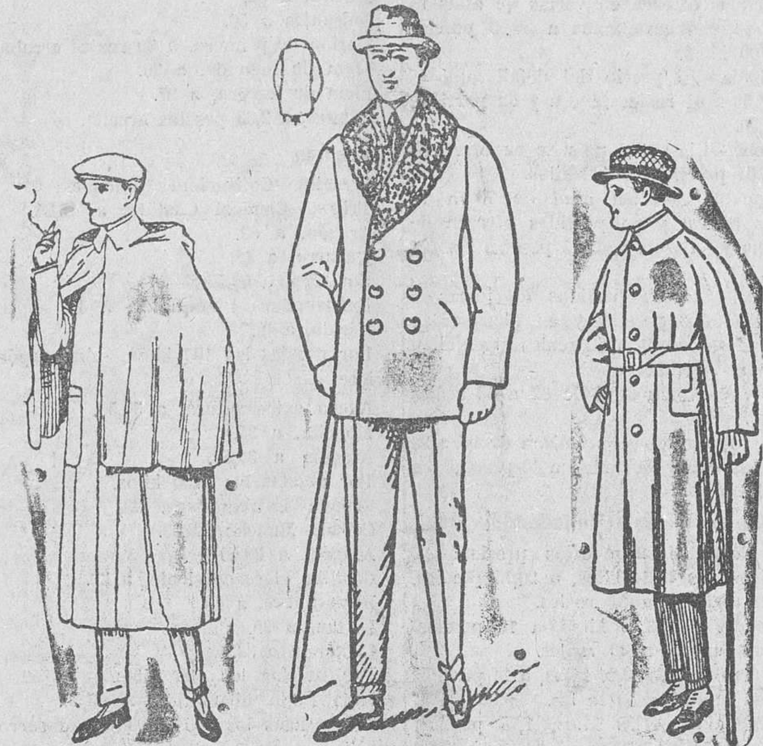
Impermeables esclavina desde 90 a 150 pesetas Pellizas: cuello rizo, en paño castor desde 20 a 125 pesetas Trincheras desde 20 a 100 pesetas 1.000 pellizas, desde 20 a 125 pesetas — 2.000 trincheras, desde 20 a 100 pesetas

Establecimiento Oficial del Turing Club Español