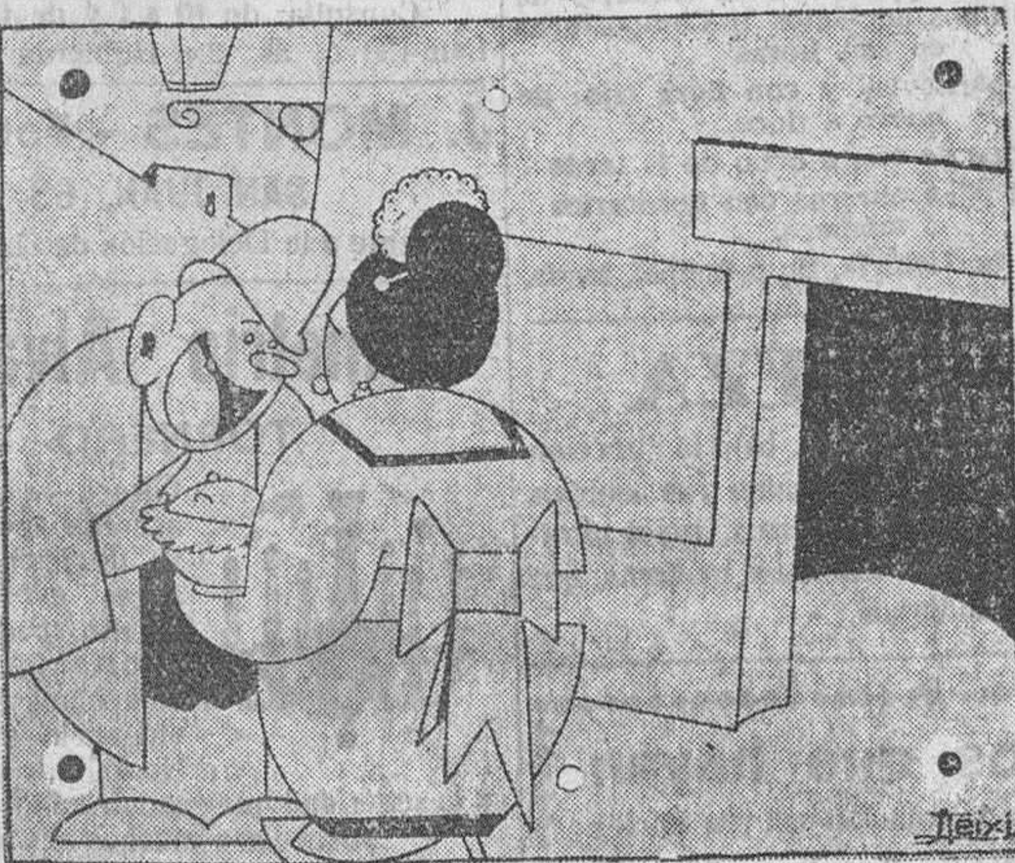
COSAS DE CHICOS