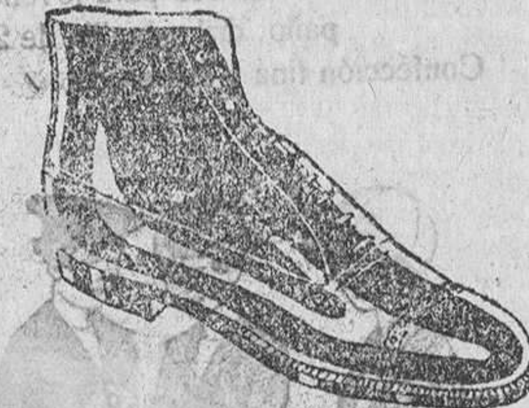
Botas en negro y color, todo cosido 19,50 pesetas