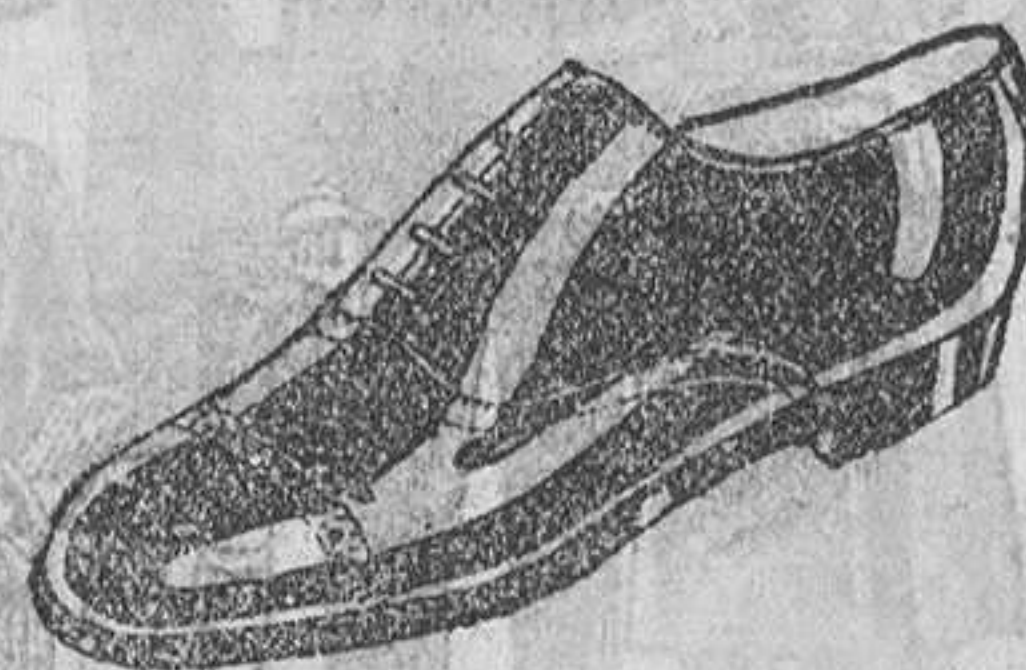
Zapatos en cinco colores distintos 18 pesetas Zapatos de charol 9,50 pesetas.

Todo cosido "GOODYEAR" Venta directa del fabricante al consumidor