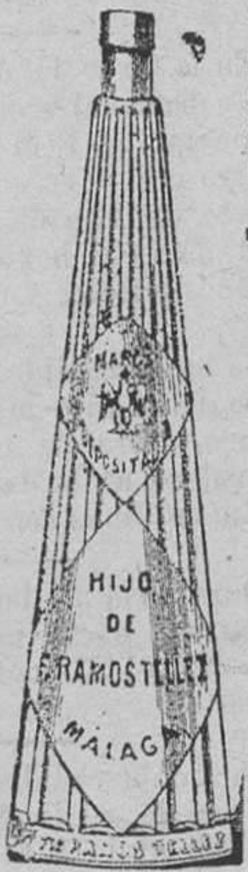
Modelo depositado de la botella de esta casa