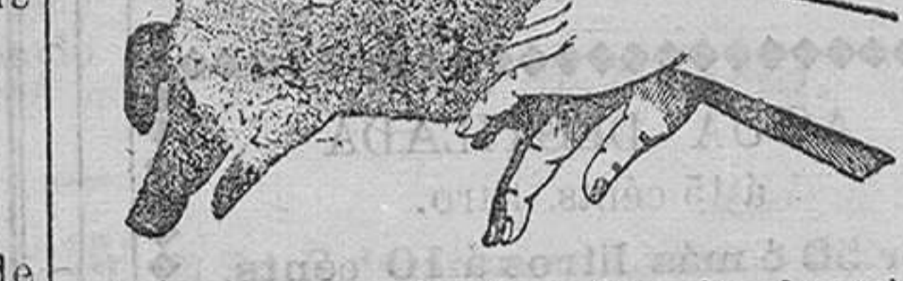
Figura quinta - El cerdo.