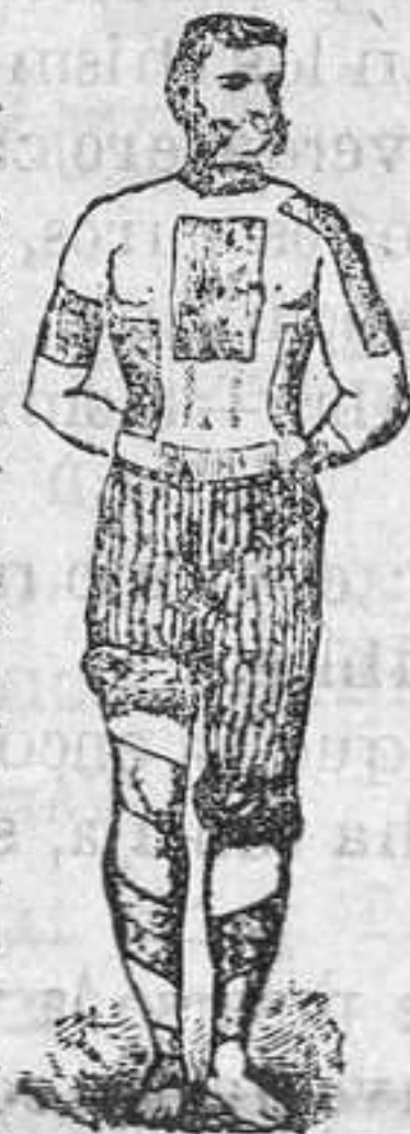
Trade Mark Registered.