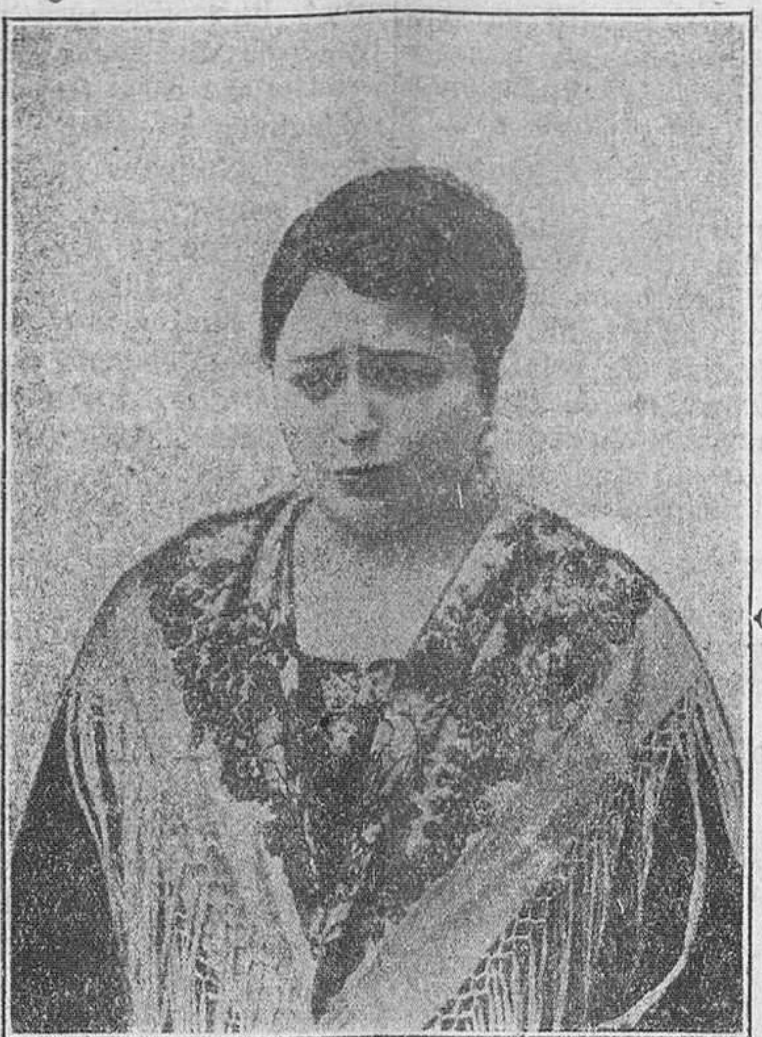
INSIGNE ACTRIZ QUE DEBUTA HOY EN EL TEATRO PRINCIPAL