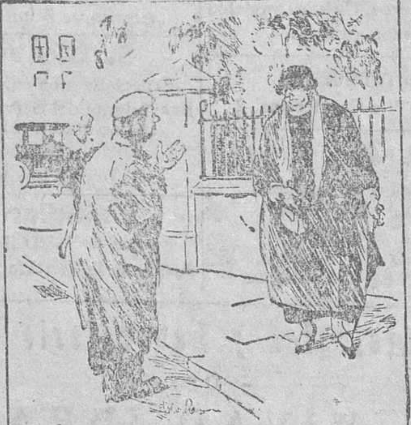
El mendigo — Señora, no siempre fui lo que soy. La señora — No. La semana pasada era usted cojo y ahora es manco.