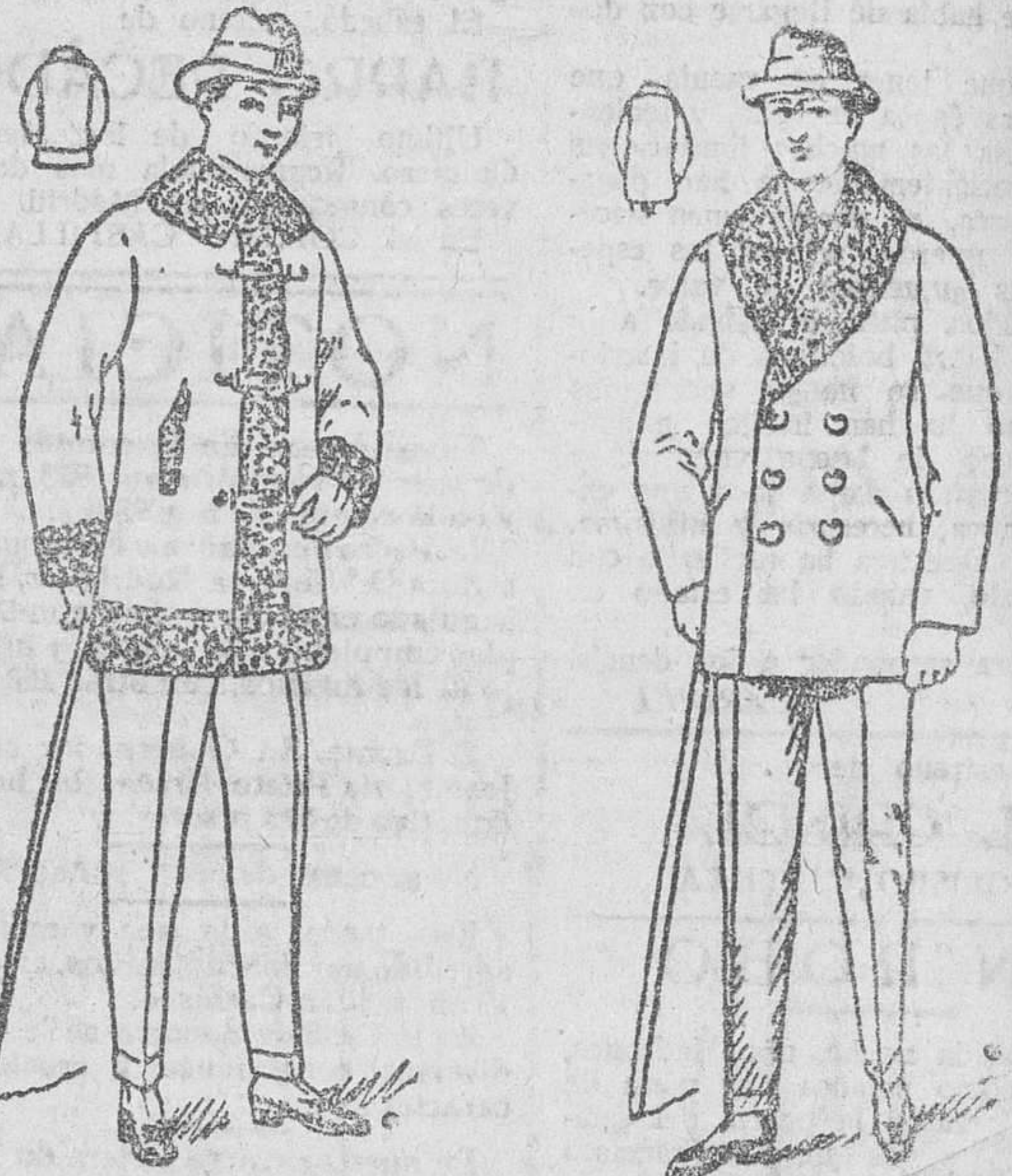
Pellicas de paño melton y castor, a 17, 20, 25, 30, 40, 60 y 100 pesetas

Gran casa de vestidos, peltería y calzado—estados de modales, medias y calzoncillos