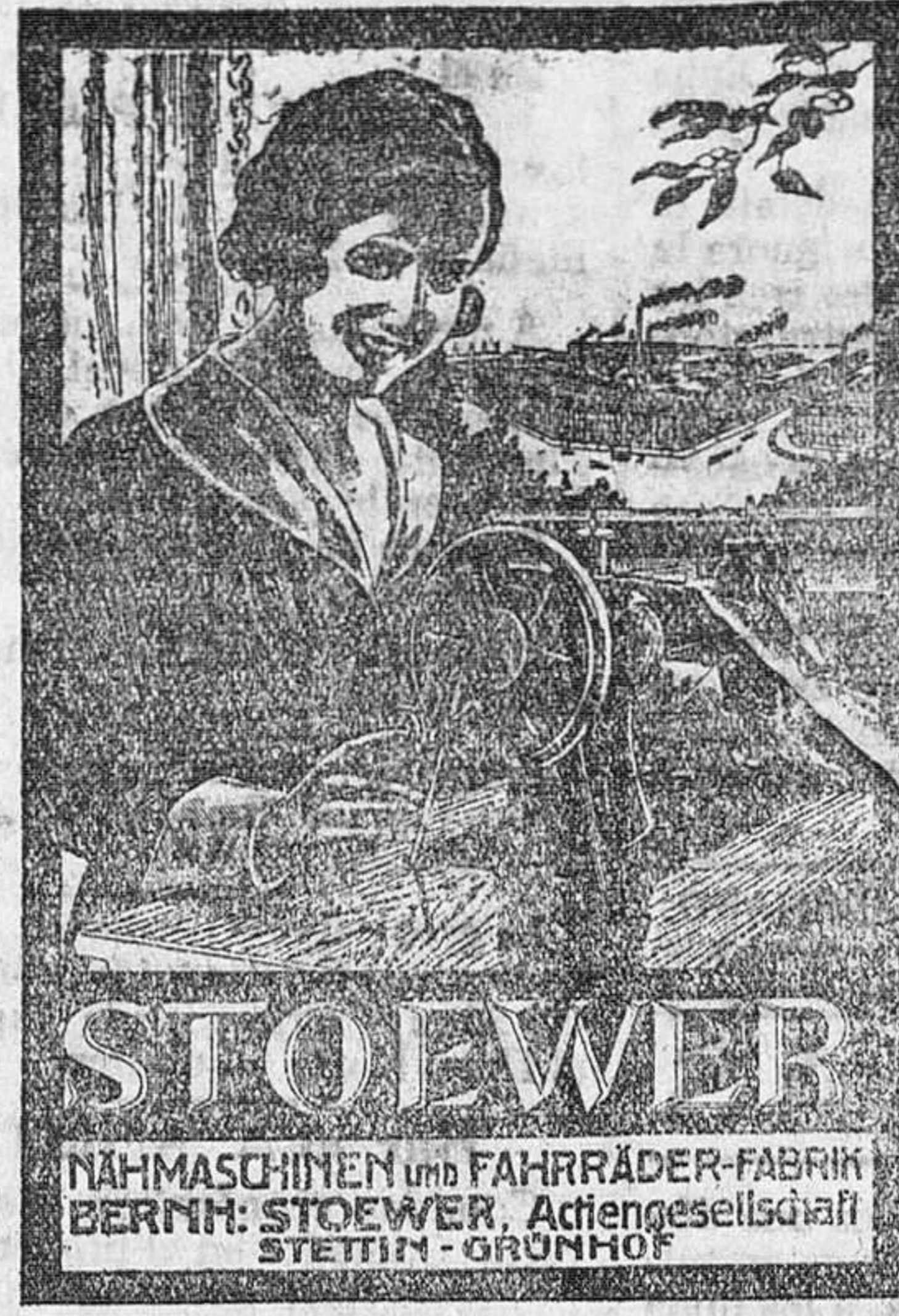
Máquina de mano, cose hacia adelante y hacia atrás, 230 pesetas.