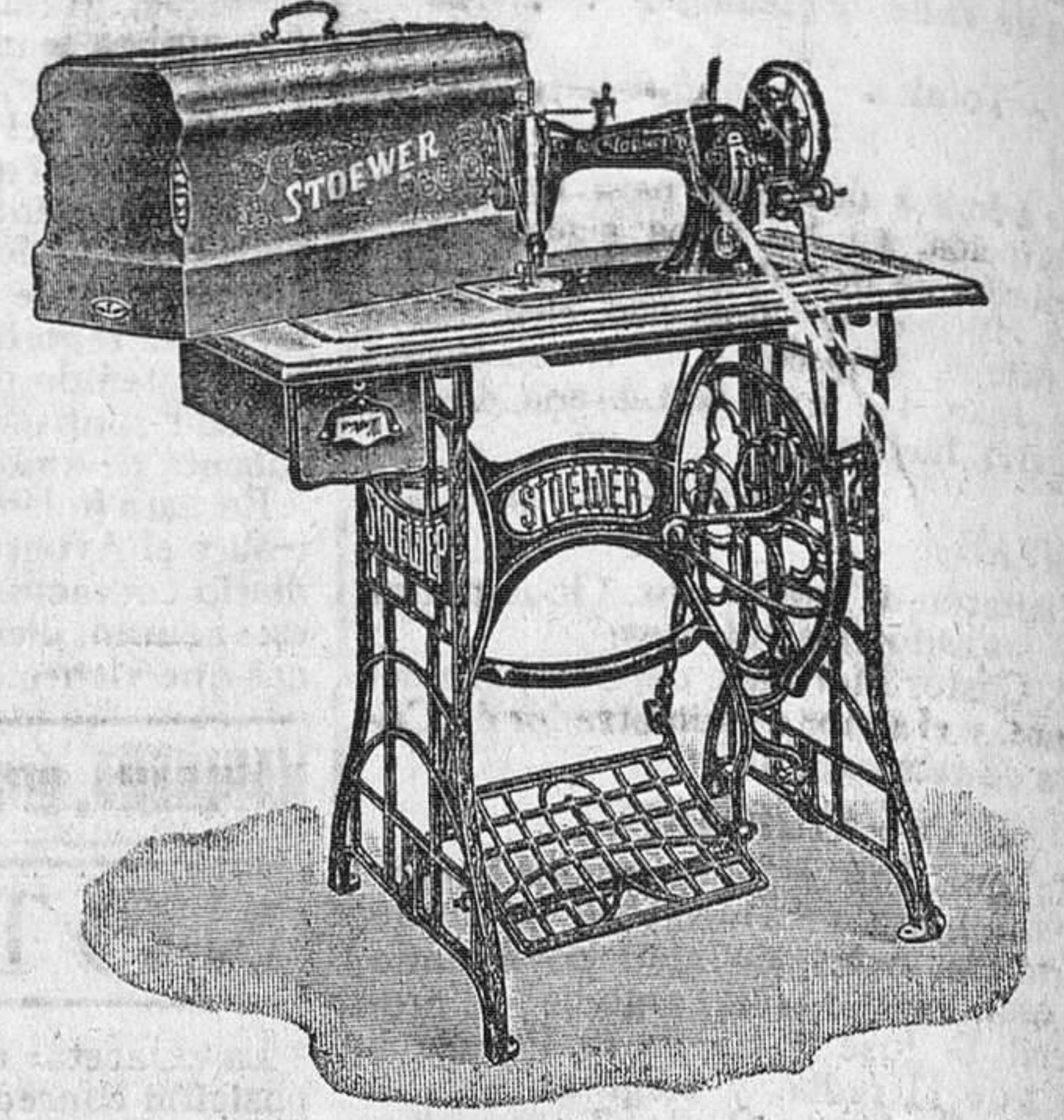
Máquina familiar, cose hacia adelante y hacia atrás, rozamiento sobre bolas, 280 pesetas.

Siempre en depósito las piezas de recambio. — Las piezas de otras marcas valen para esta. — Máquinas al contado y a plazos.