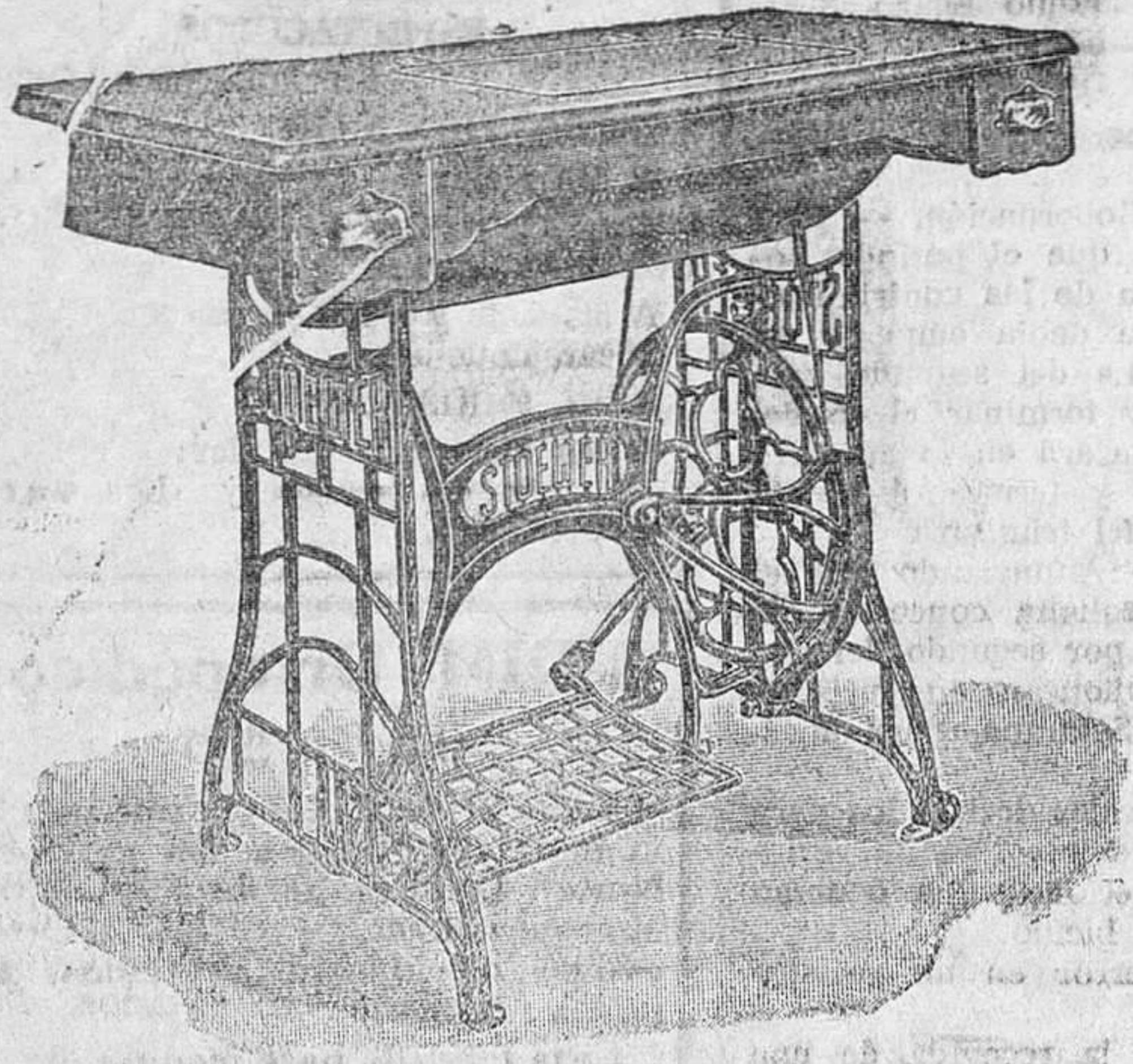
Mueble bonito, dos gavetas, 415 pesetas.