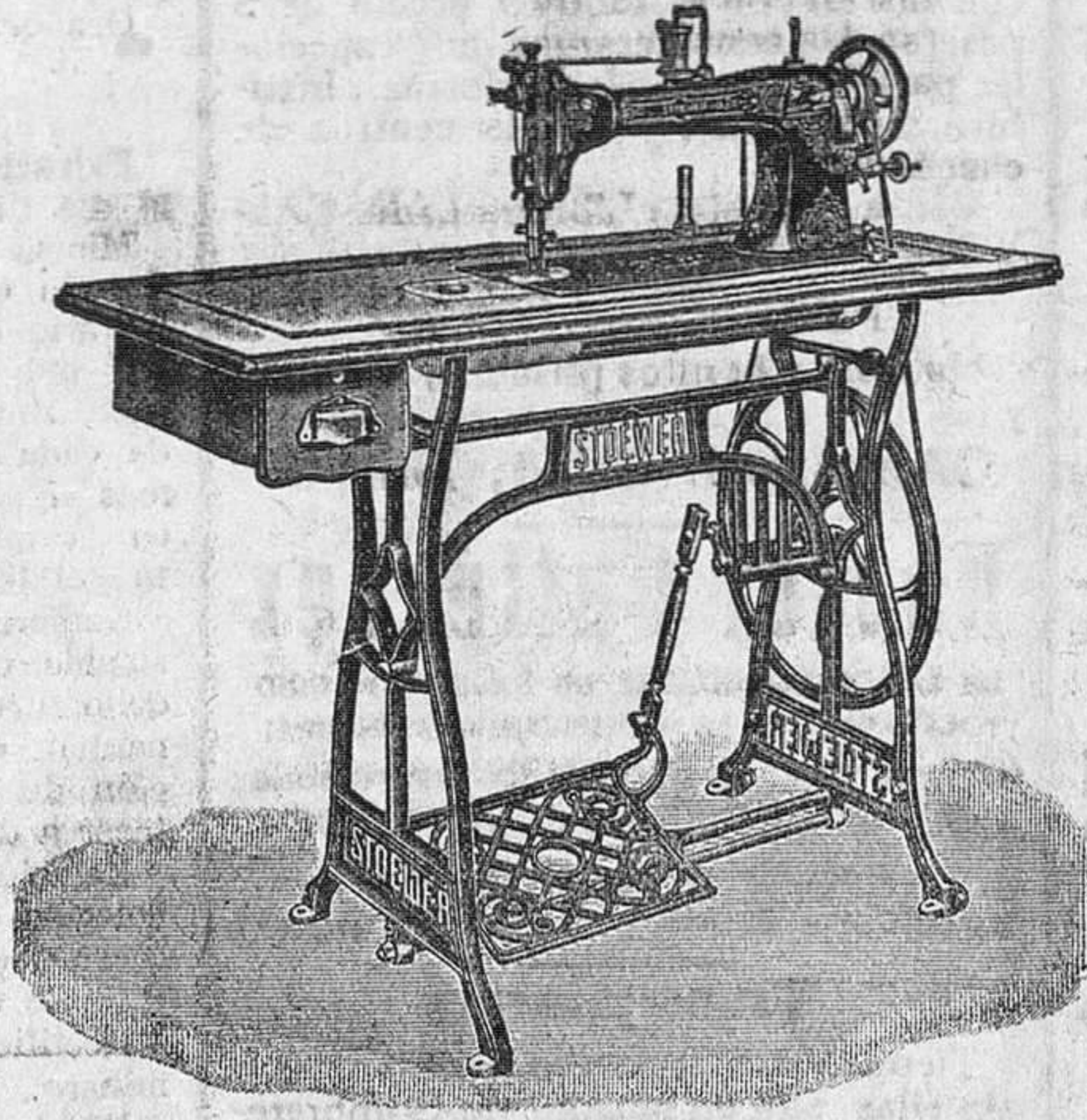
Gran modelo de máquina rotativa, a gran velocidad, para sastrés, talleres de labores grandes, cuero, etc., 400 pesetas