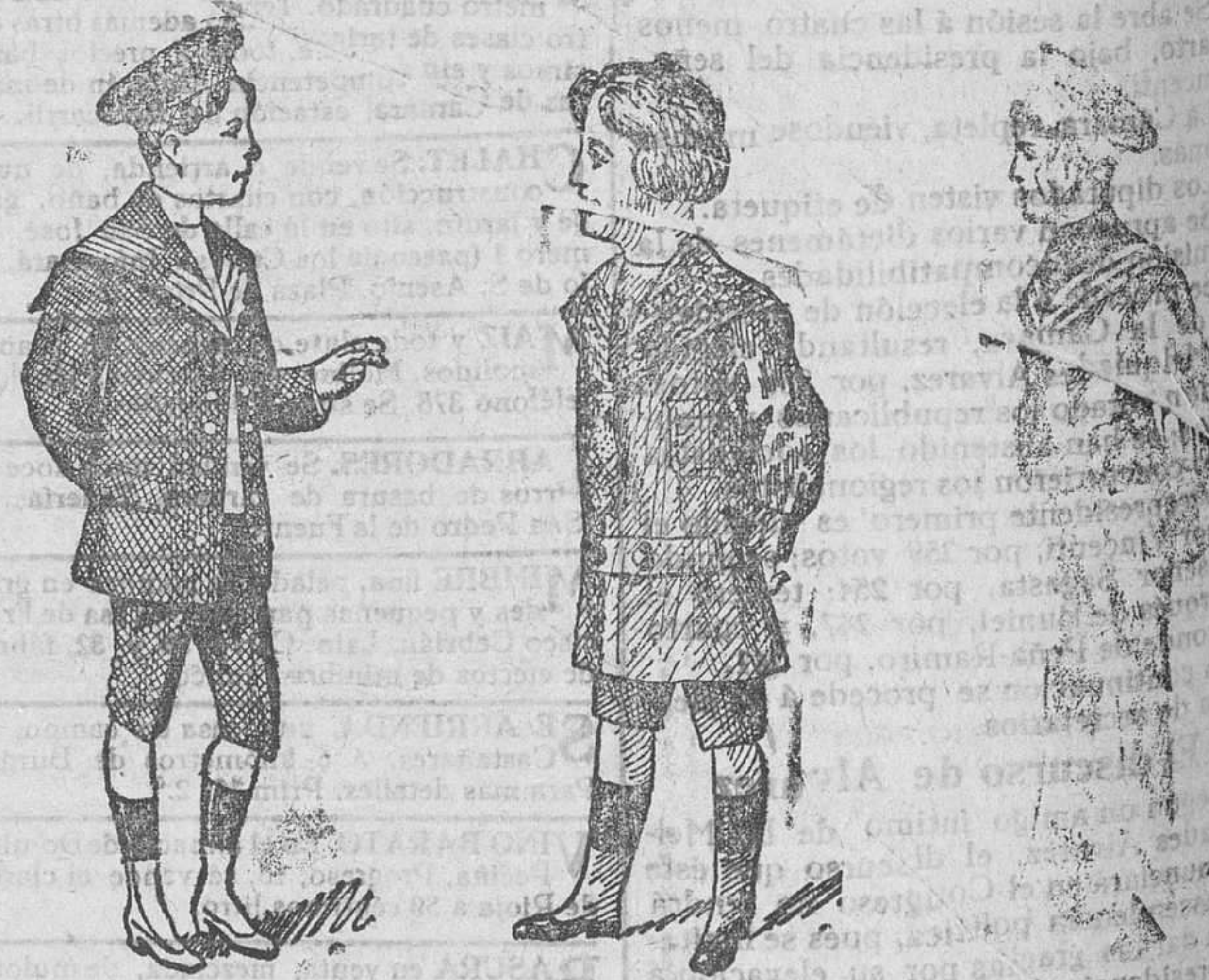
Sesenta modelos diferentes en trajecitos de dril, paño y pana, desde 8 a 50 pesetas

Gran casa de tejidos, pañería y confecciones de caballero, señora y niños