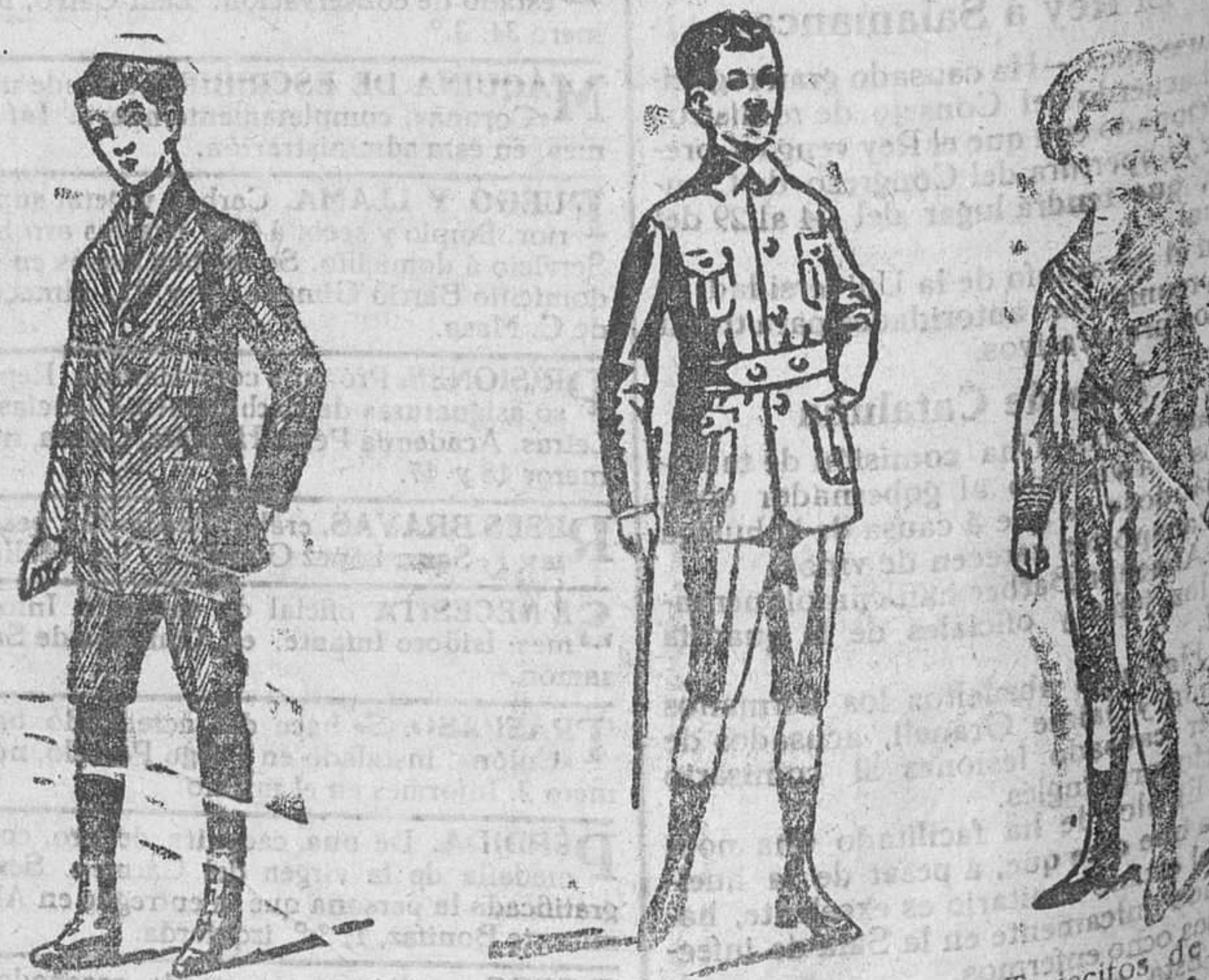
Trajes para jovencitos, en paño y dril, desde 20 a 70 pesetas Trajecitos forma «sport», de paño y dril, a 18, 20, 25 y 30 pesetas. Trajecitos de jersey azul y alpaca blanca, desde 30 a 65 ps.