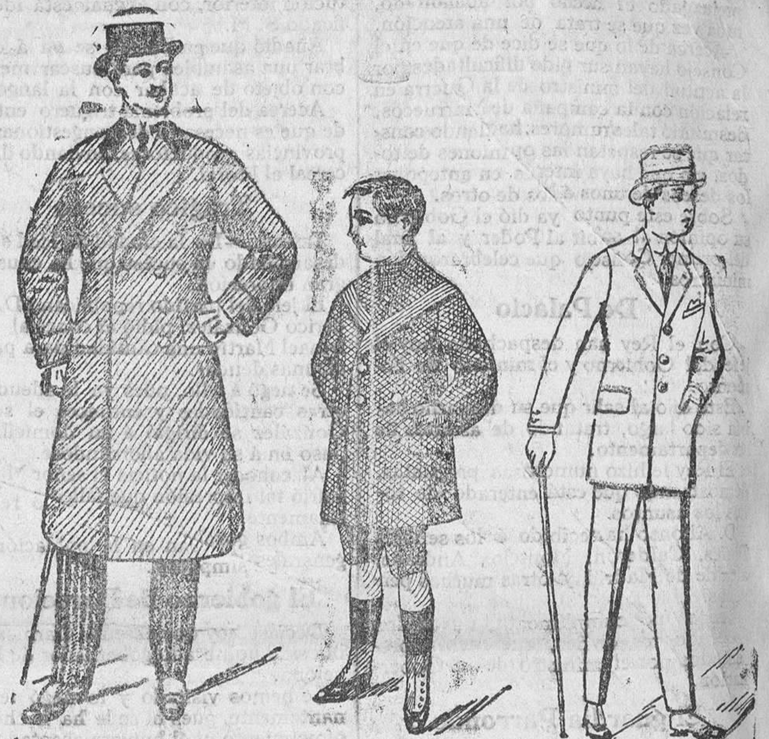
Gabanes de caballero de 60 á 120 pesetas Abrigos de niños desde 20 á 60 ptas. Trajes caballero, esmerada confección, de 45 á 150 ps. Siempre en esta casa encontrarán grandes surtidos en toda clase de prendas hechas

Gran casa de tejidos, pañería y confecciones de caballero, señora y niños