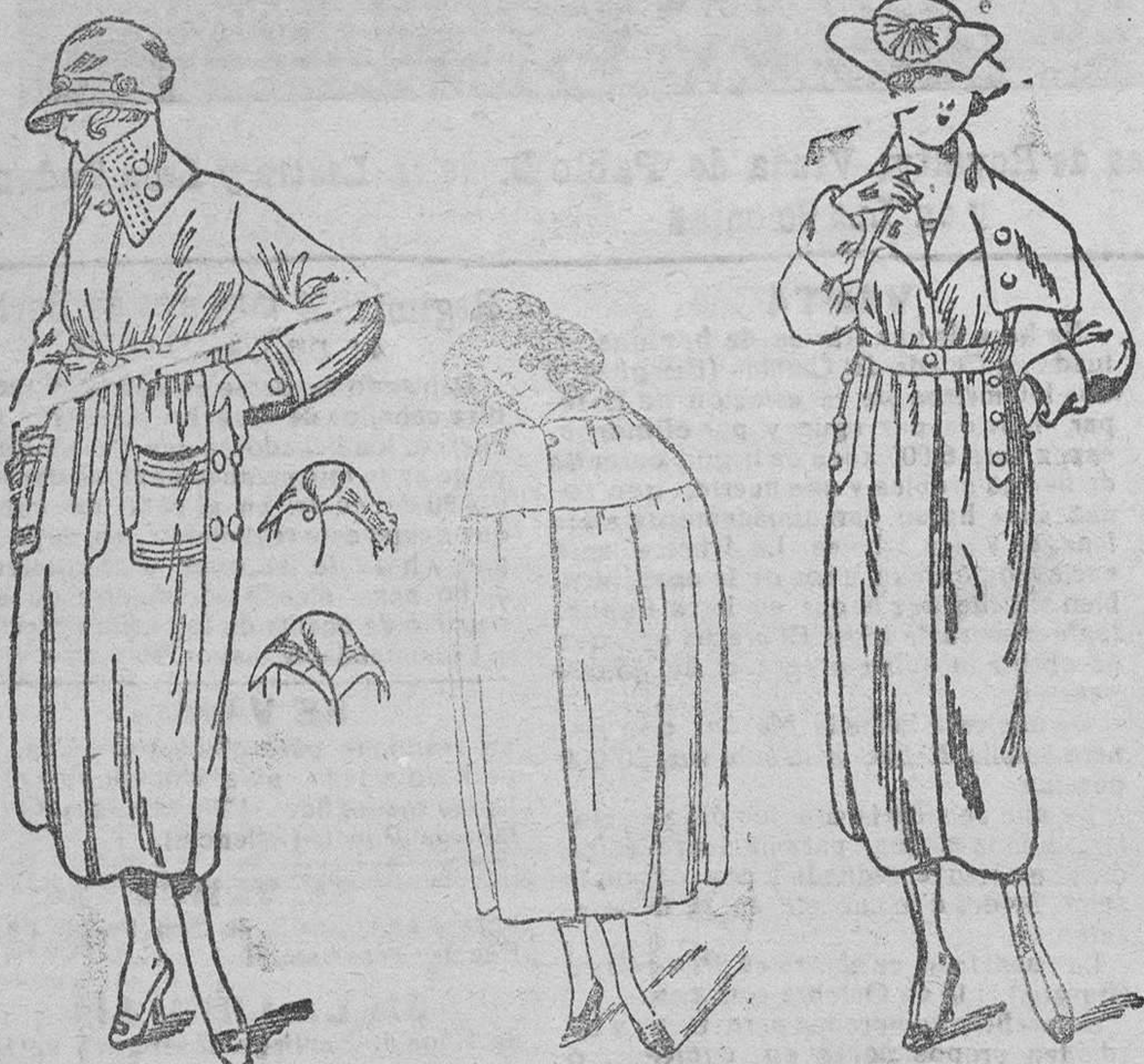
Grandes novedades en abrigos de paño, desde 30 á 175 pesetas Capas novedad, desde 60 á 180 pesetas

Gran bazar de ropas confeccionadas de caballero, señora y niñas