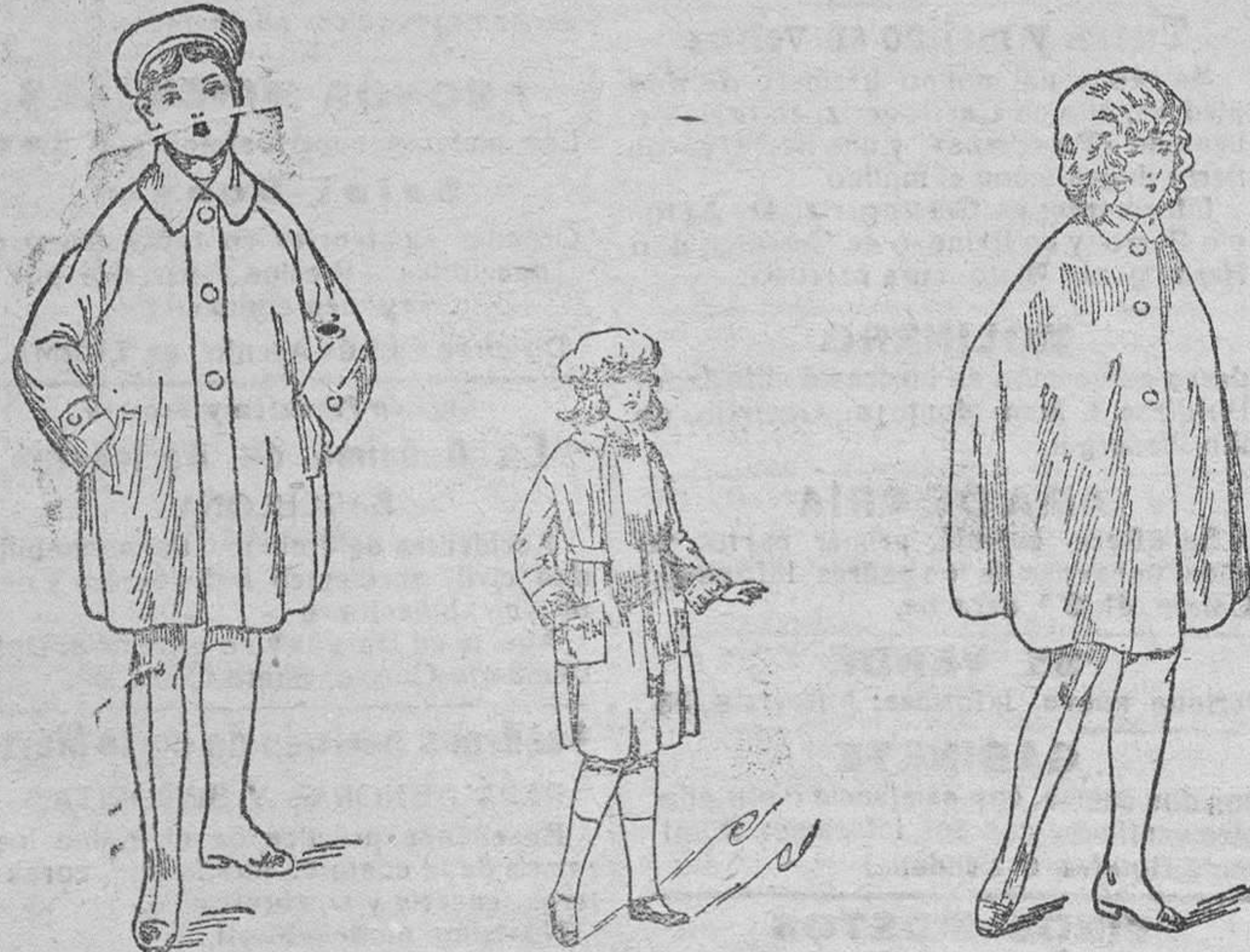
Abrigos impermeables, de niñas á 22 25 30 y 35 pesetas Abrigos de paño, para niñas, á 12, 15, 18 y 20 pesetas Capitas impermeables, de niñas desde 12, 15, 18, 20 y 25 pesetas