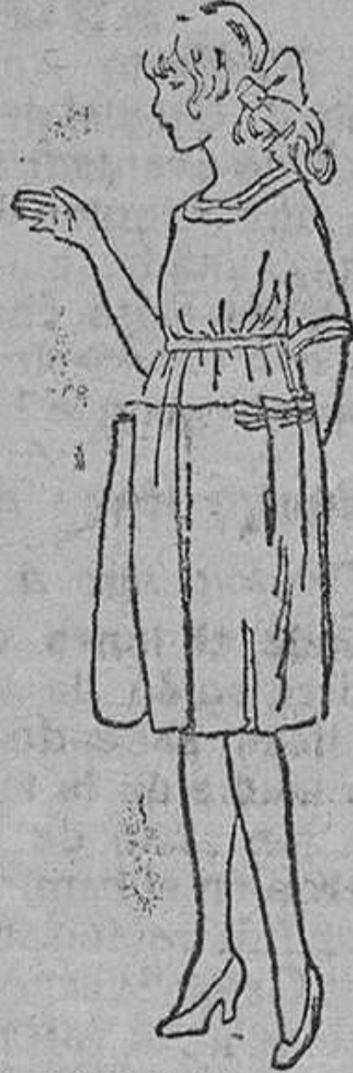
Vestidos para niñas en lana, á 14, 16, 18, 20, 25 pts. Modelos novedad