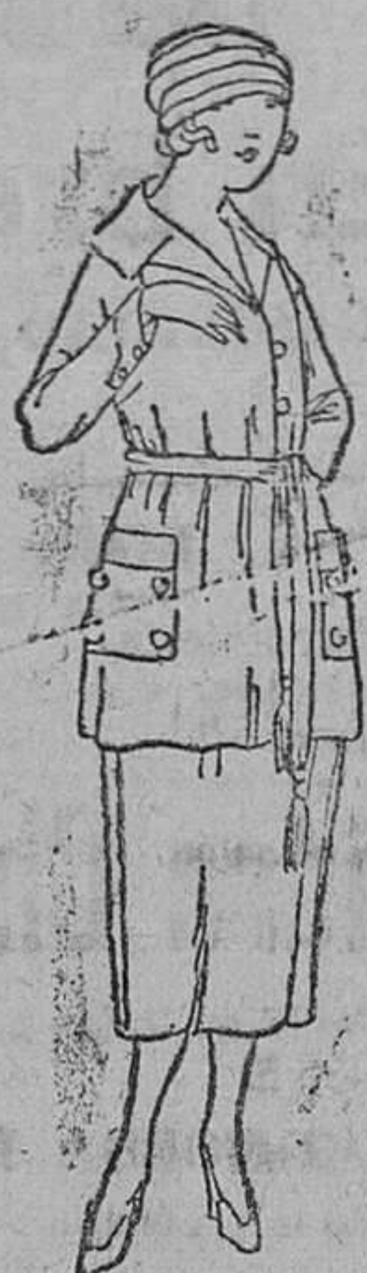
Vestidos de levita y falda, en lana, á 45, 50, 60, 70 y 80 pts.