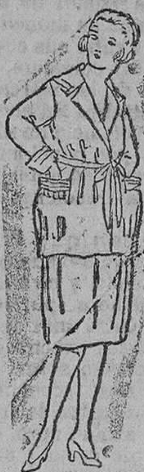
Trajecitos para jóvenes, en algodón, á 30 y 35 pts.