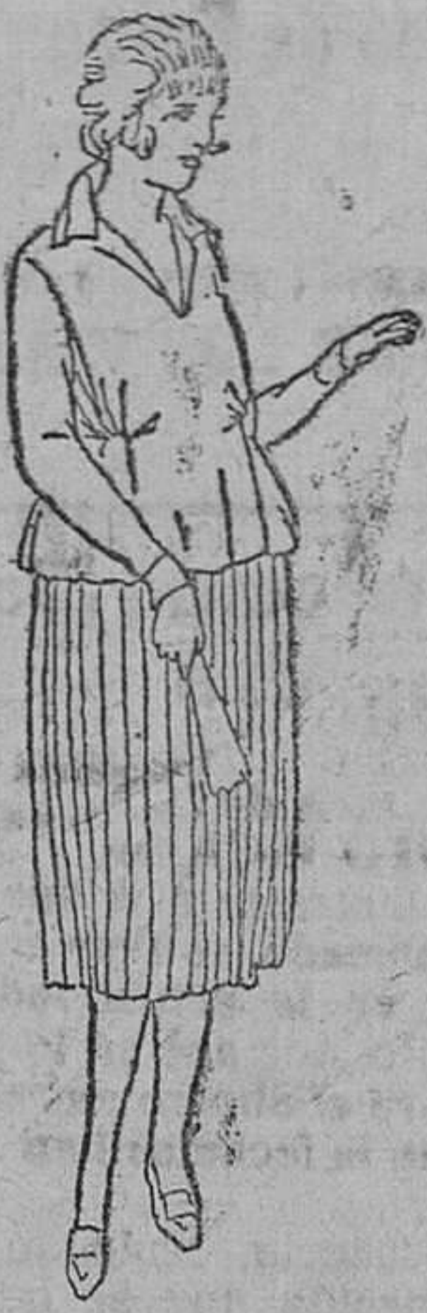
Blusa punto seda á 35, 40 y 50 pts. Falda plisada á 30, 35 y 40 pts.

En esta sección de señoras y niñas, encontrarán siempre los últimos modelos en vestidos enteros y de levita, en todos los colores, clases y estilos.