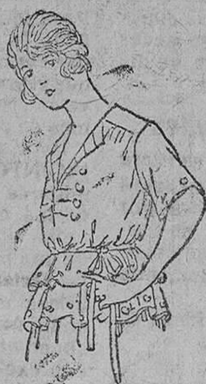
Blusas de punto, en diversidad de colores, 14, 15, 16, 20 y 25 pts.