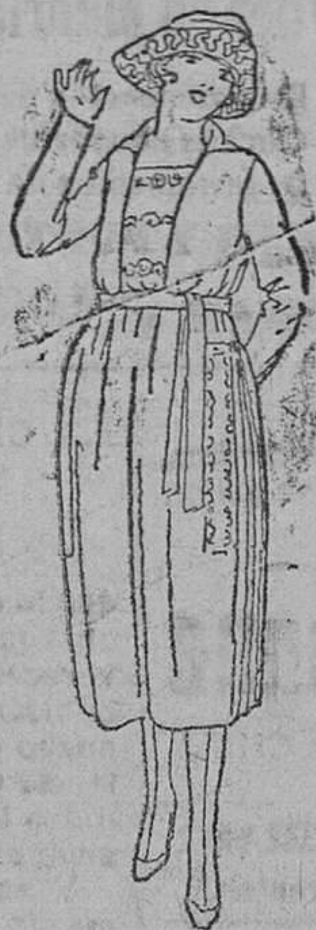
Vestidos enteros, en lana y color, á 35, 40, 45, 50 y 55 pts.