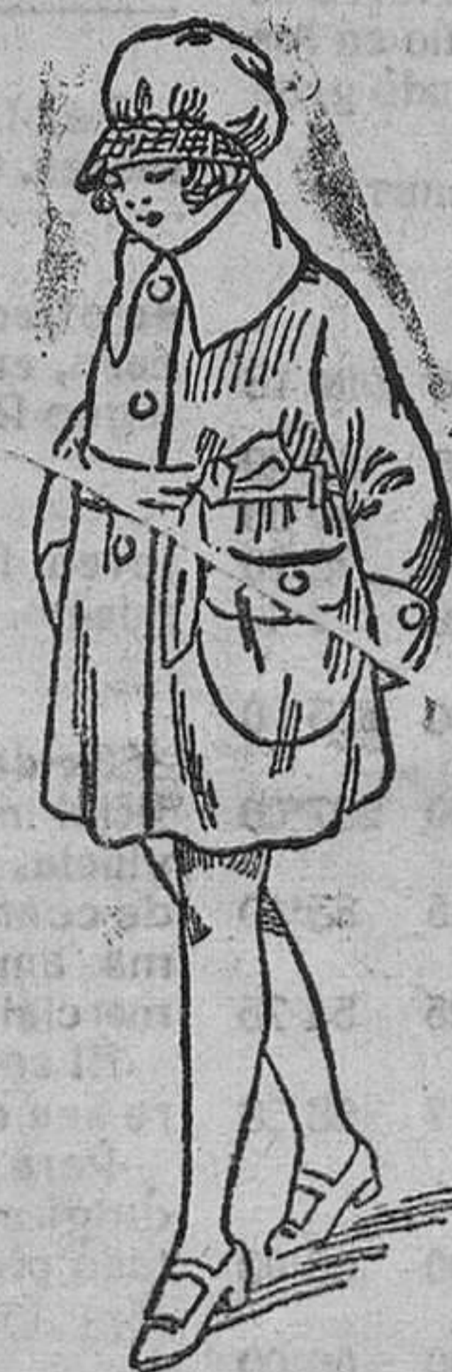
Abrigos paño gamuzas formas y colores novedad, para niños de 4 á 8 años, á 10, 13, 15 y 20 pts. Id. de nueve á quince, á 22, 24, 28 y 30 pts.