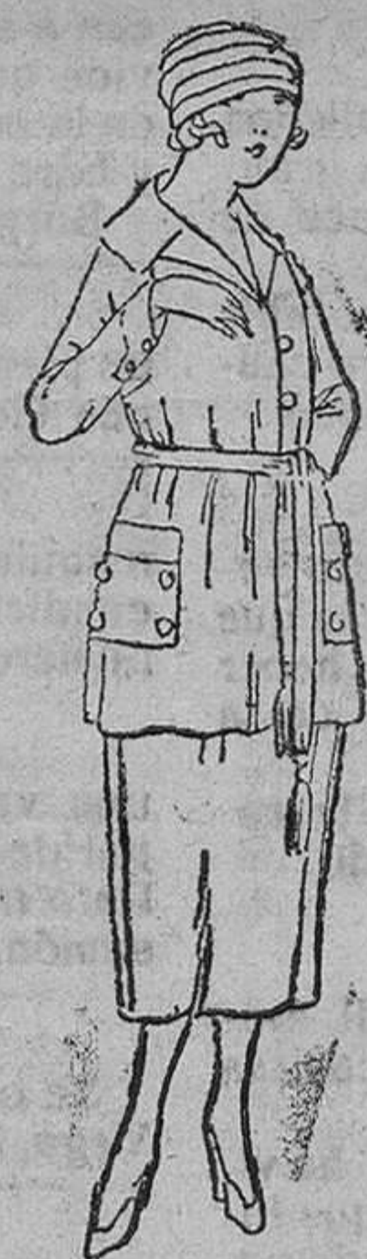
Trajes de levita, en negro, azul y colores, desde 50 á 120 pts.