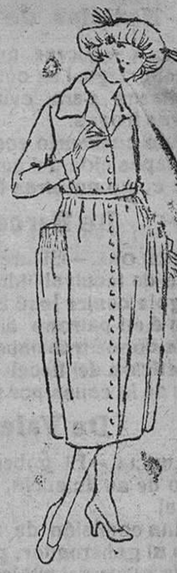
Trajes enteros, en algodón, color liso y listado, de 18 á 40 pts.