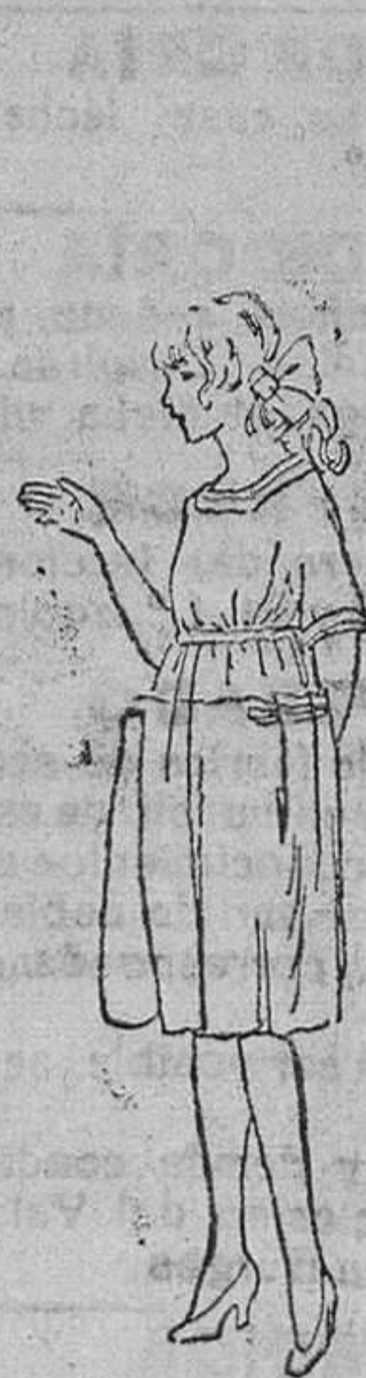
Vestiditos niñas de tres á siete años, en las colores novedad, á 10, 12, 15, 18 y 20 pesetas.