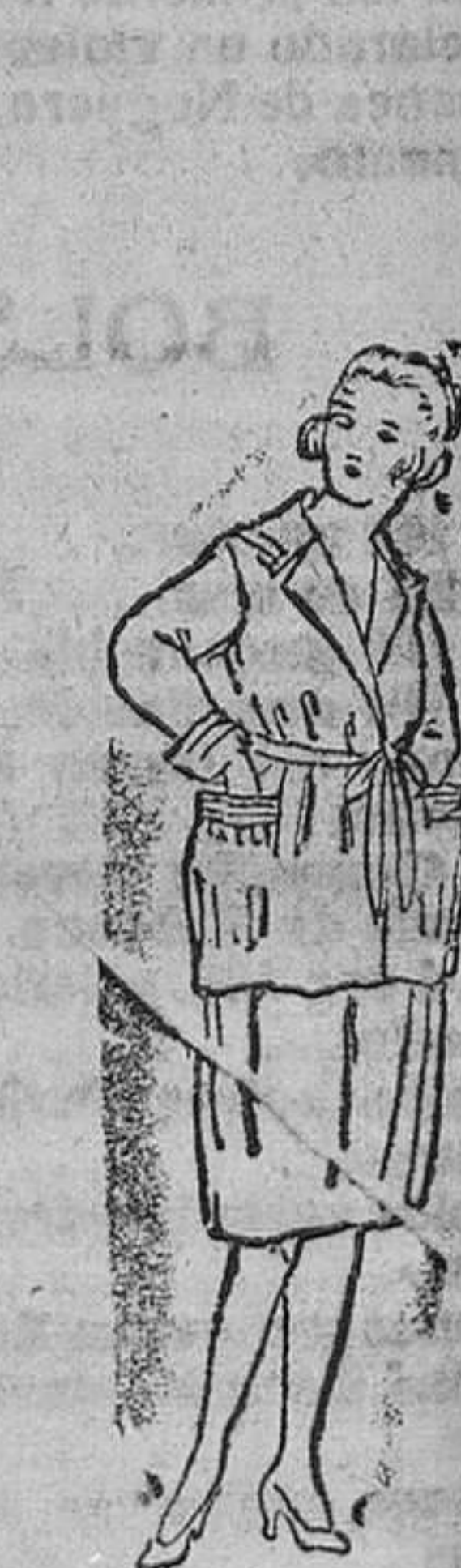
Trajes de levita para jóvenes, en lana, azul, negro y colores, desde 35 á 50 pesetas.