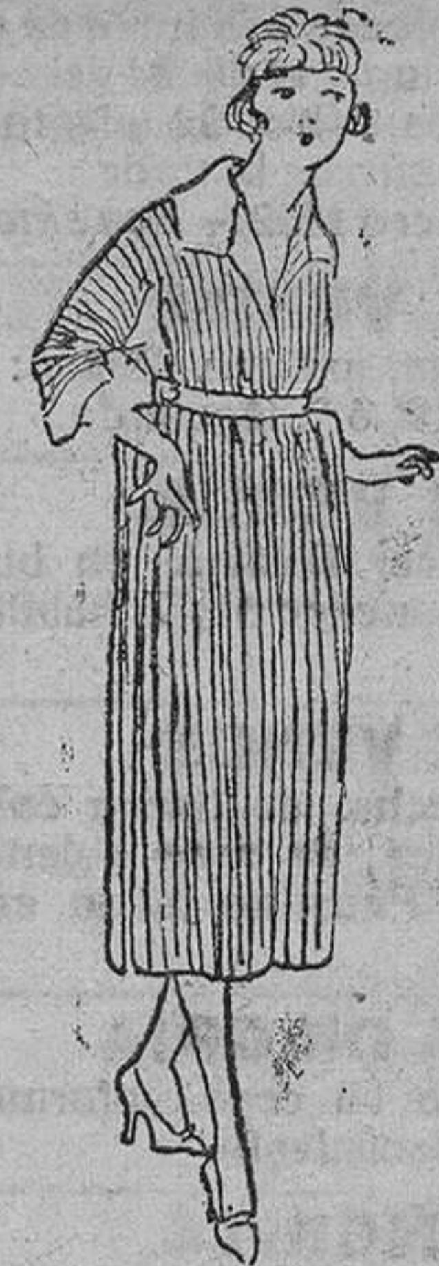
Vestido entero de lana, en azul, negro y colores, de 35 á 100 pts.

Primera casa en confecciones de caballero, señora, niños y niñas