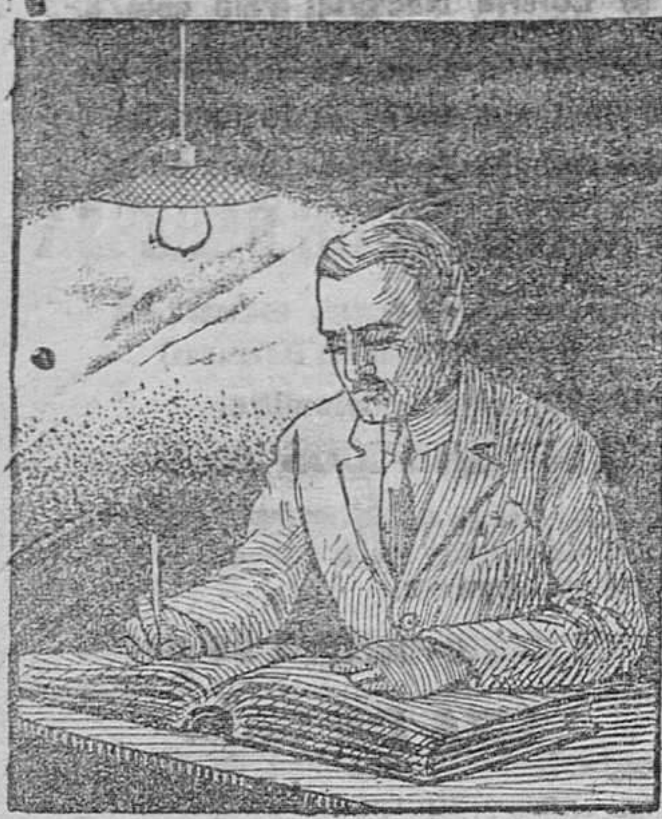
TRABAJANDO CON LÁMPARA DE FILAMENTO METÁLICO