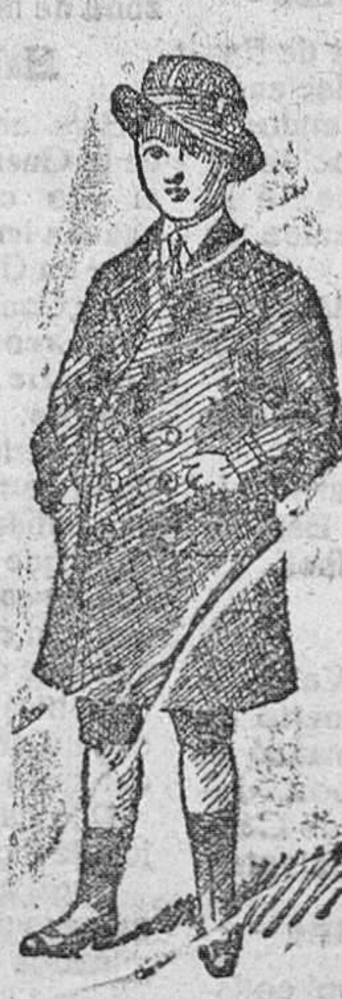
Gabancitos para jóvenes, forma novedad, desde 40 á 90 pesetas.