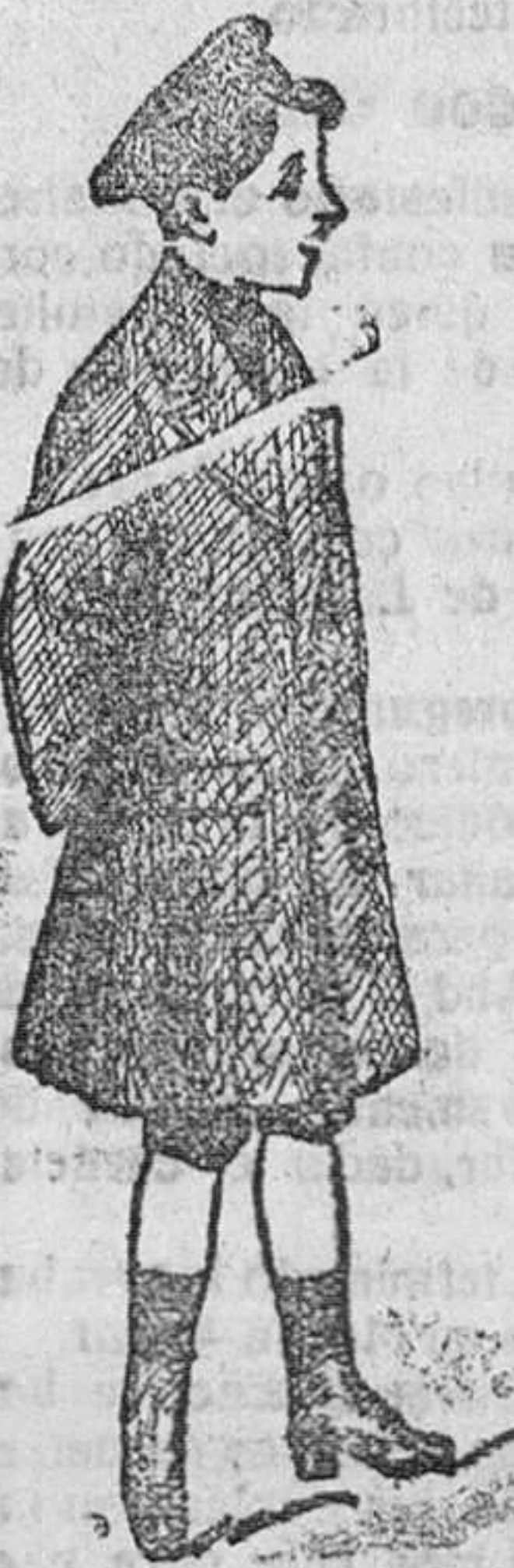
Abrigos de paño para niños, desde 20 á 50 pesetas.