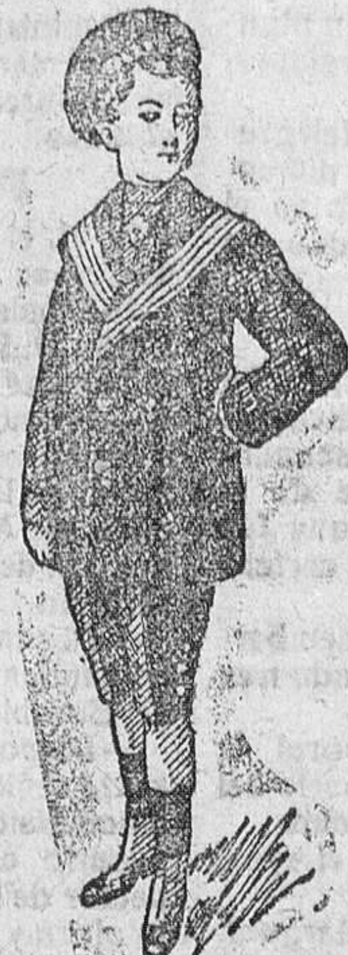
Trajes azules, cañaca, desde 20 á 35 pesetas.