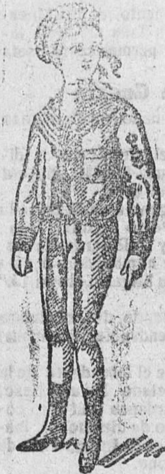
Trajecitos vicuña azul á 15, 17 y 20 pesetas.

Primera casa en confecciones de caballero, señora, niños y niñas