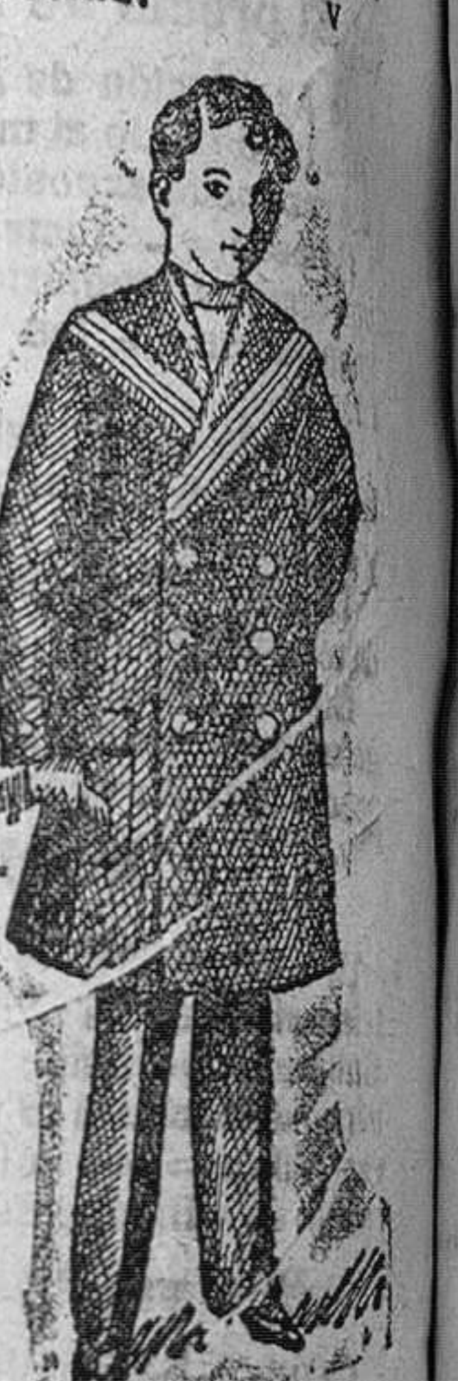
Mateos para niños, en vicuñas azul y negro, desde 25 á 50 pts.