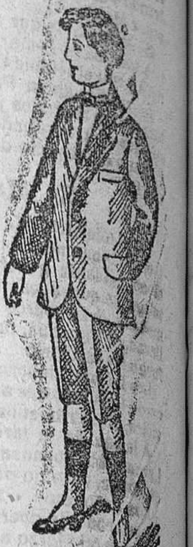
Trajecitos para vicuñas desde 25 á 40 pesetas.