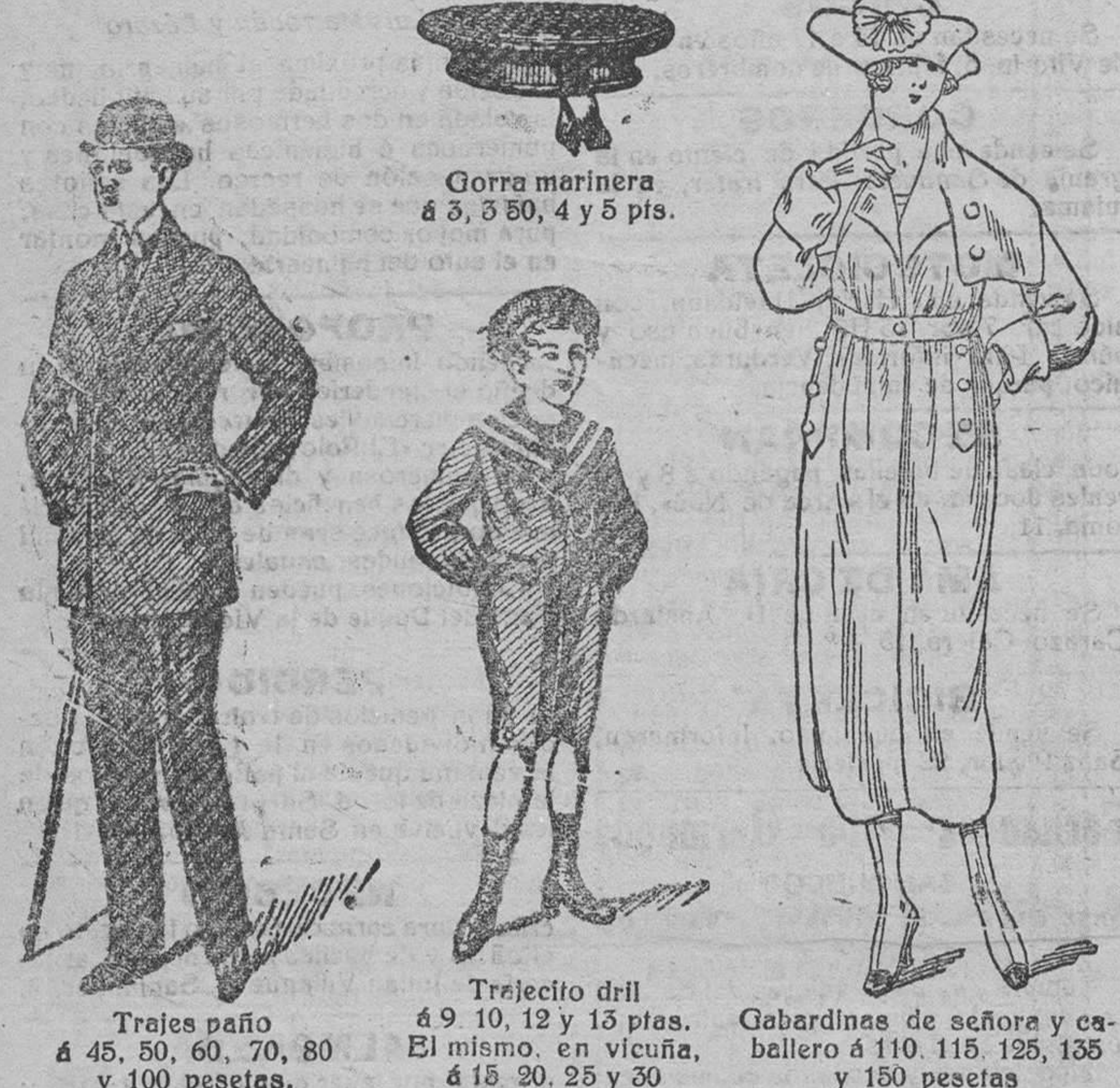
Gorra marinera á 3, 5, 10, 4 y 5 pts.

CASA MUNGUA. (Sucesor de Rebollo) Plaza Mayor, 42, y Lain-Calvo, 9.—Teléfono núm. 88.—Burgos