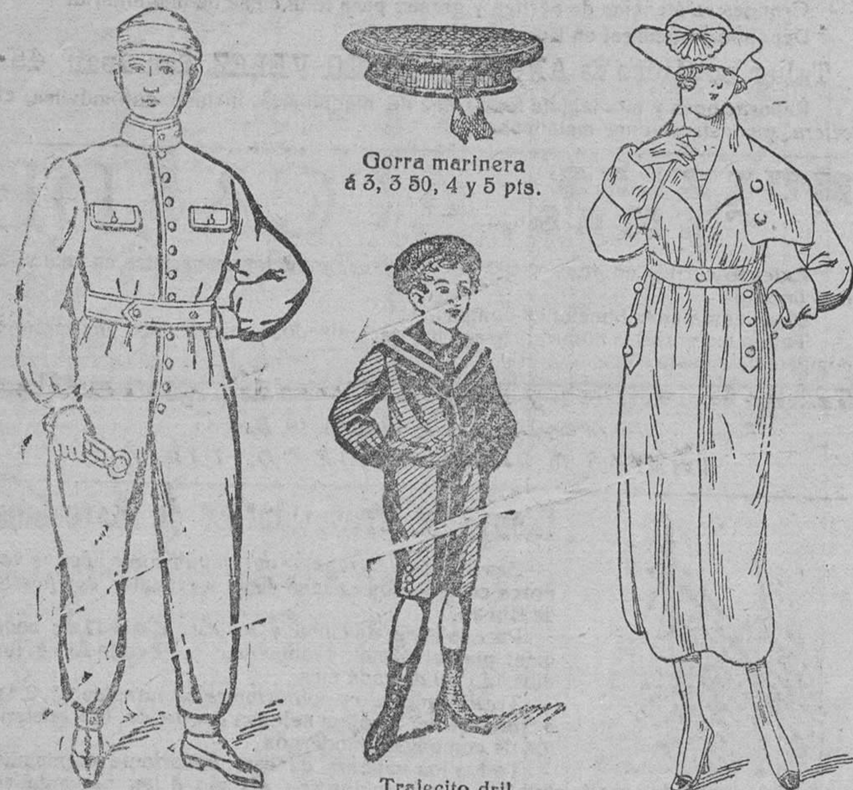
Gorra marinera á 3, 3'50, 4 y 5 pts.

Plaza Mayor, 42, y Lain-Calvo, 9.--Teléfono núm. 88.--Burgos