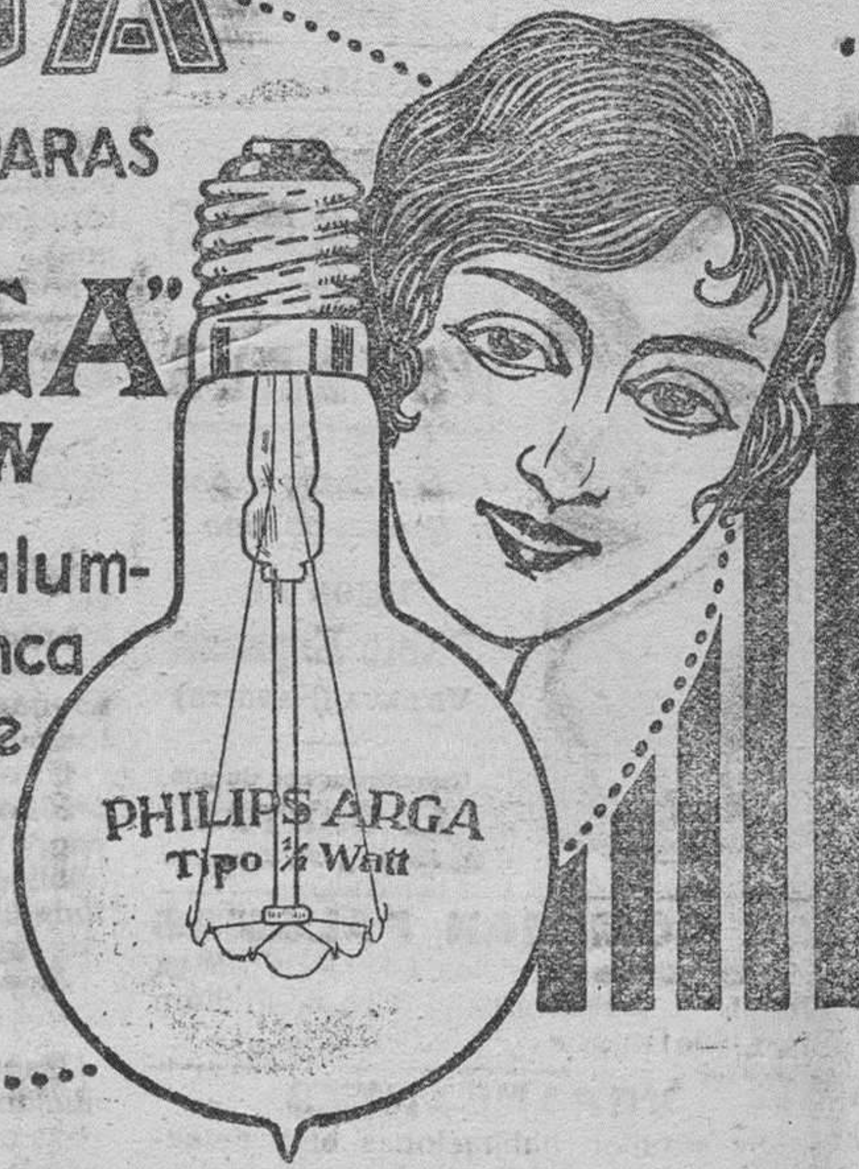
PHILIPS 'ARGA' TIPO 1/2 WATIO

Es inútil ocultar la verdad. Las modernas lámparas PHILIPS-ARGA sustituirán en breve plazo las de filamento metálico, que ya no convienen.