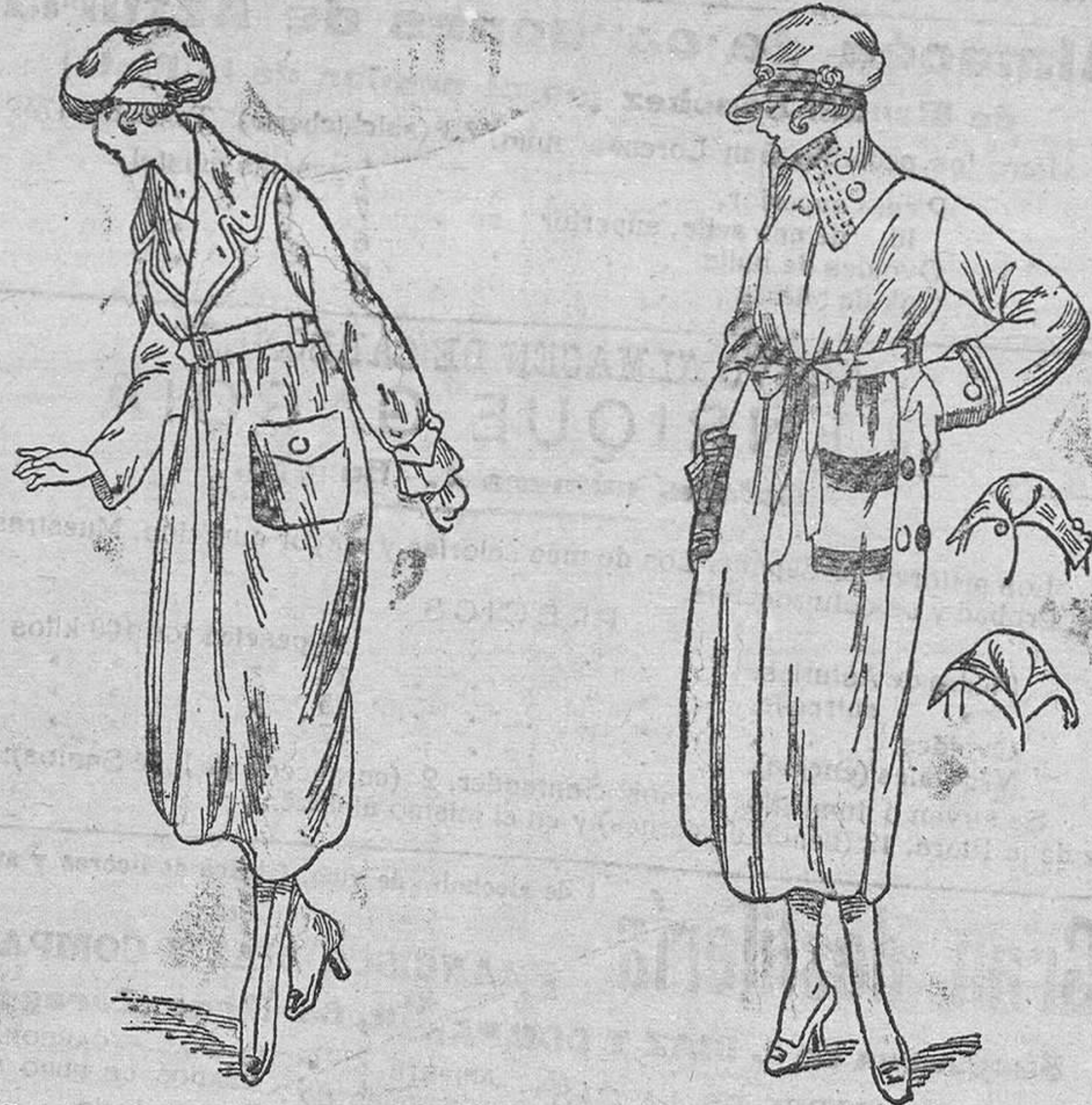
Dos nuevos modelos en Impermeables de señora, en negro y color, desde 35, 40, 50, 60 y 75 pesetas.

Plaza Mayor, 42; y Lain-Calvo, 9.-Teléfono núm. 88.-Burgos