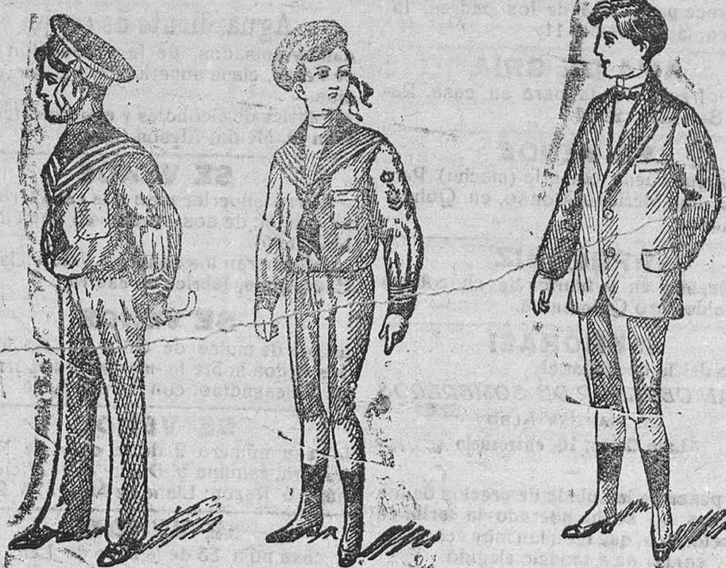
Trajecitos de vicuña á 15, 18, 20 y 25 pesetas. De gerga azul á 25, 30, 35 y 40 pesetas

CASA MUNGUIA. (Sucesor de Rebollo) Plaza Mayor, 42, y Lain-Calvo, 9.—Teléfono núm. 88.—Burgos