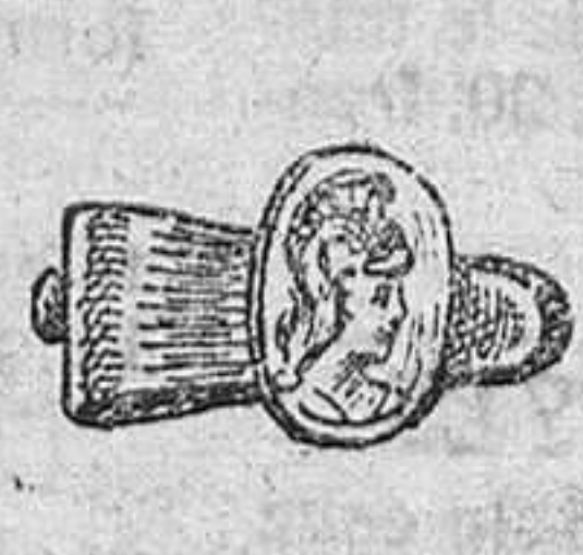
Sujetadores á 60 céntimos uno