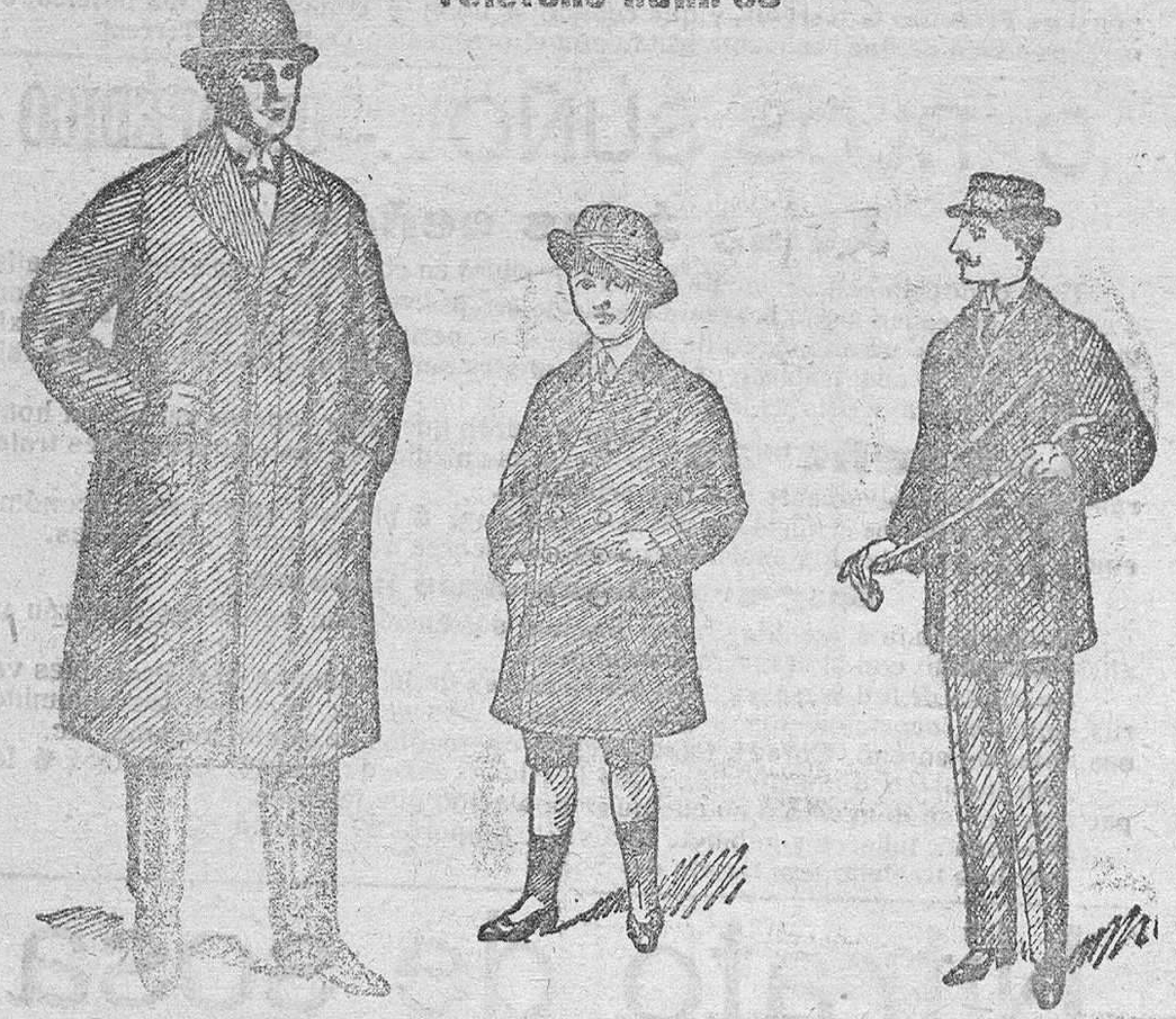
Gabanes de caballero y jóvenes, desde 40 a 125 pesetas. Siempre últimas novedades. Gabanes para juveniles, desde 25, 30, 35, 40 y 50 pesetas. Pelizos desde 18 a 75 pesetas. Grandes surtidos.

CASA MUNGUÍA. (Sucesor de Rebollo) Plaza Mayor, 42, y Lain-Calvo, 9.-Sucursal: Paloma, 6.-Burgos Esta casa acaba de recibir grandes remesas en gabanes, pelizos, mantones, tapabocas, capas, mantillas de seda, pasamontañas, capotes para el campo, impermeables negros y color para milliter y paisano. Siempre a precios económicos - Precio fijo Teléfono núm. 88