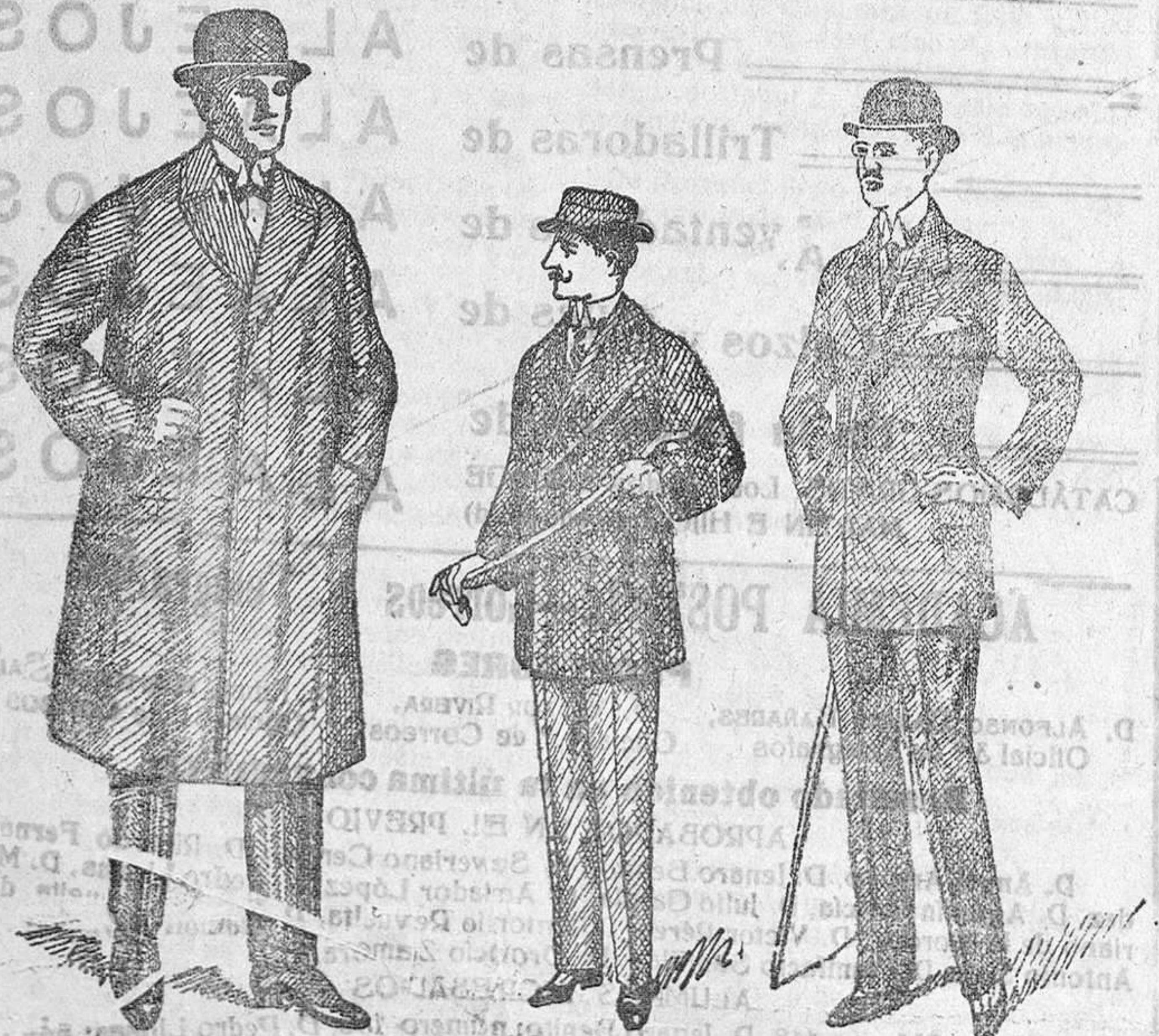
Gabanes de caballero y jóve. Pellizas desde 18 á 75 pesetas. Trajes paño de 30 á 70 ptas. nes, desde 40 á 125 pesetas. pana de 25 á 60. Siempre últimas novedades. Grandes surtidos. dril de 20 á 35.

Siempre á precios económicos — Precio fijo