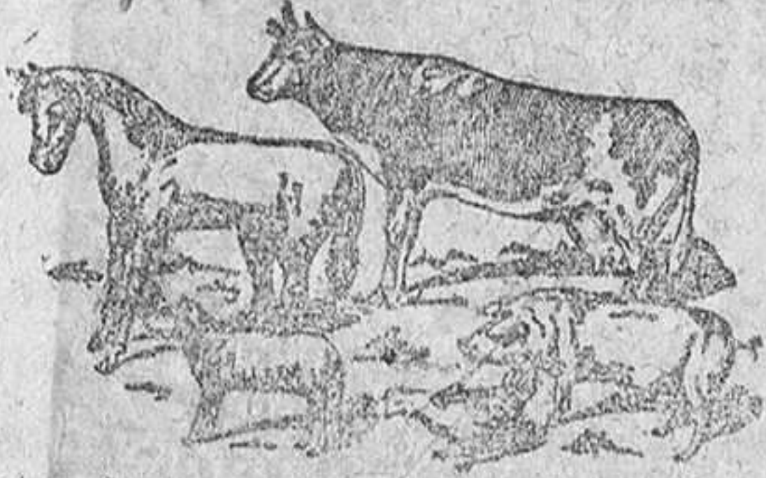
Antes de tomar El Engorde Castellano de Liras , hay ganado anémico, sin apetito, hace malas digestiones, enferman.