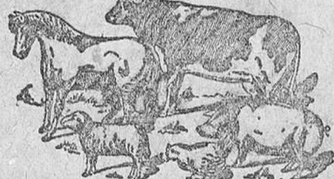
Tomando El Engorde Castellano de Liras comen con gusto, aumenta el número de glóbulos de la sangre, hacen buenas digestiones, pesan más.

Los poderosos reconstituyentes del sistema óseo (huesos) y del organismo en general, como son: compuestos hidrocarburos, ácido fosforico, hierro asimilable, fosforos puros, depurativos, sal sódica y azufre, estimulantes, aperitivos vegetales que hacen al ganado que coma con gusto, etc., etc.