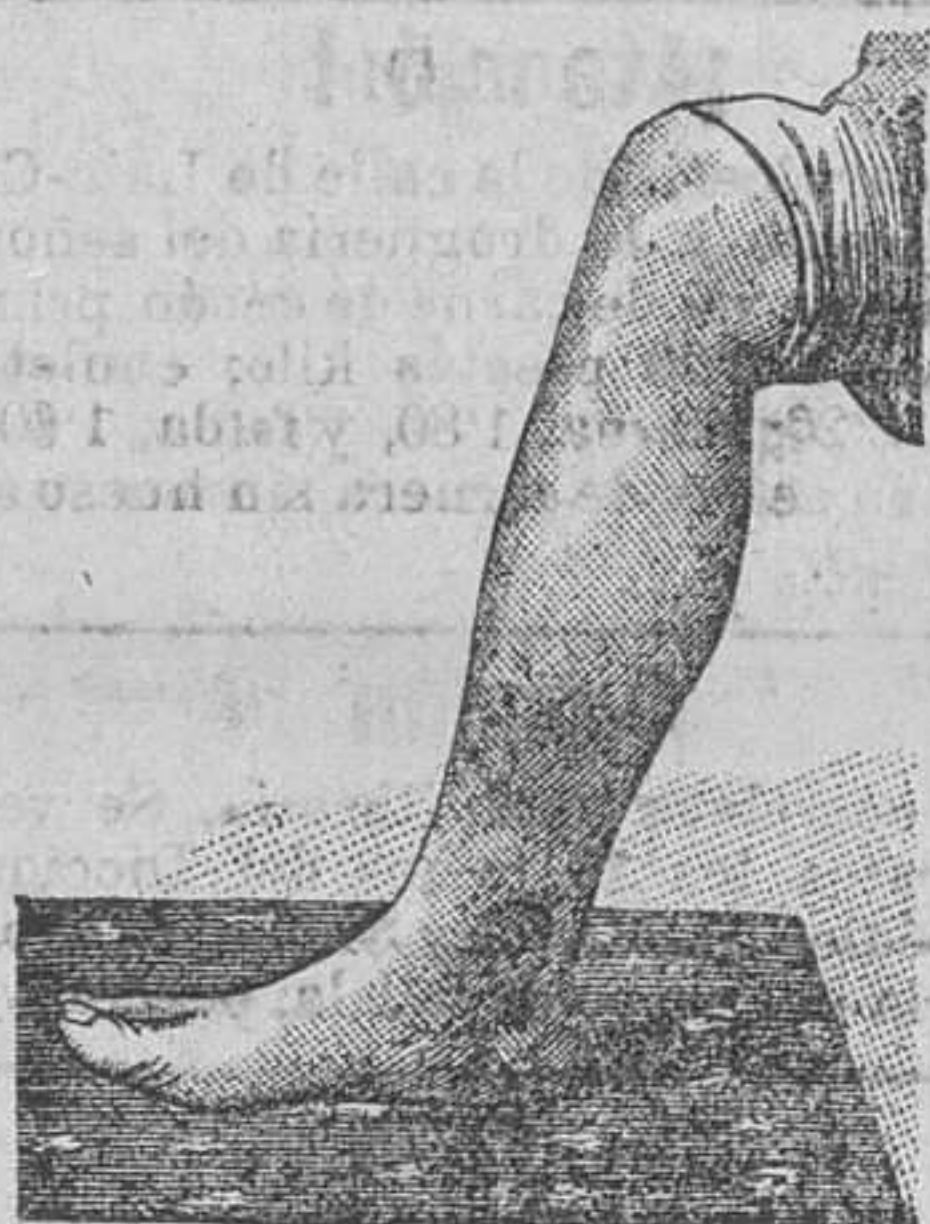
A los 15 días de tratamiento