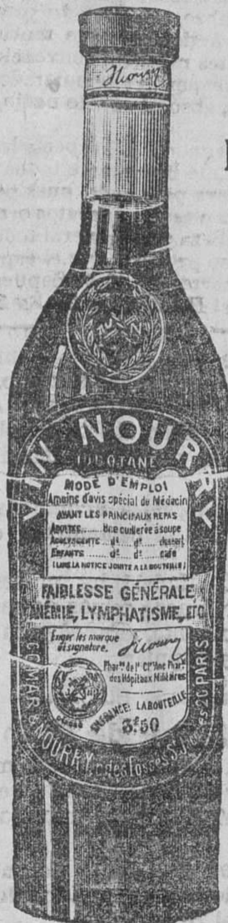
Se vende en toda Farmacia acreditada.

Por su sabor agradable y su eficacia, el VINO NOURRY reemplaza ventajosamente al aceite de Hígado de Bacalao, y, además, despierta el apetito.