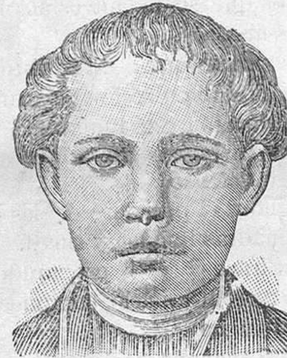
A los 15 días tratamiento