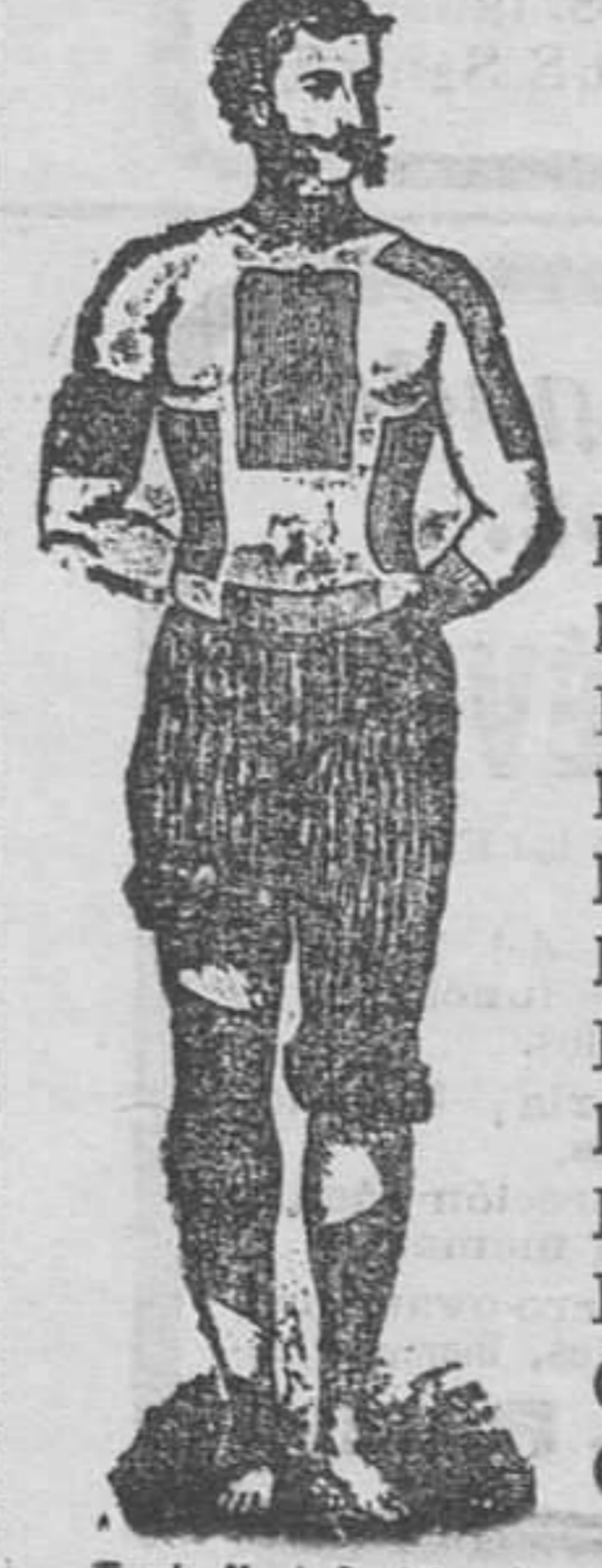
Trade Mark Registered.