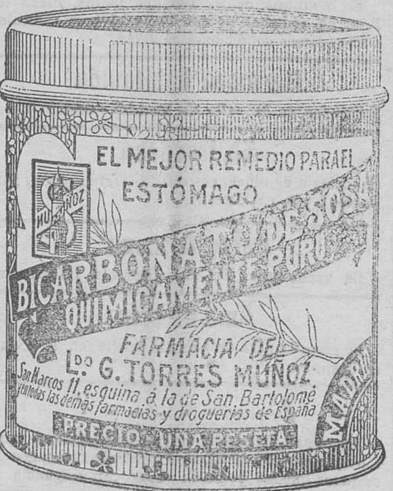
LATAS ECONÓMICAS, A 5 PESETAS.

En el pueblo de Tardajos (diez kilómetros de Burgos) una magnífica habitación, en casa nueva, con bonito jardín y preciosas vistas. Para detalles dirigirse al farmacéutico de dicho pueblo.